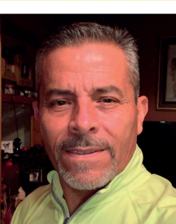
Por Alfredo Mendoza R.