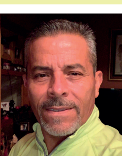
Por Alfredo Mendoza R.

Y si a los participantes del Tianguis Turístico se les ocurre preguntar sobre nuestros paradores costeros a lo largo de la autopista escénica, ¿qué les vamos a decir? ¿La verdad o