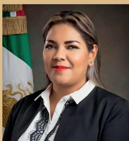
A la diputada DUNNIA MONTSERRAT MURILLO sus seguidores la quieren disputando la alcaldía de San Quintín en las elecciones del 2027.

El Carnaval 2025 se realizará del 27 de febrero al 04 de marzo.