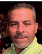
Por Alfredo Mendoza R.

Que el despacho, contratado hace años para defender los intereses del ayuntamiento ante la empresa Energía Costa