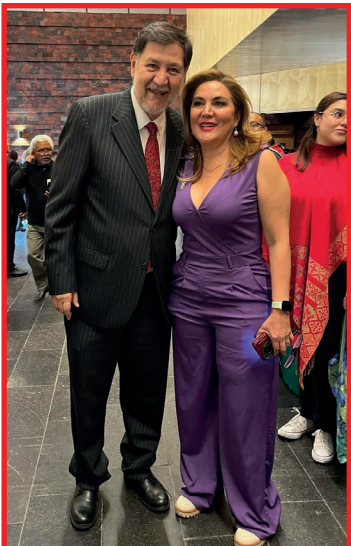
La presidenta municipal de San Quintín, MIRIAM CANO, saludó en la CDMX a personajes con gran fuerza política en Morena, entre ellos al presidente del Senado de la República, GERARDO FERNÁNDEZ NOROÑA.

Será la primera ocasión que un presidente del Senado viene con la intención de visitar la mayoría de los municipios de la entidad, lo cual hace sospechar que, a NOROÑA, como es mejor conocido, el corazón le late como burro sin mecate por la Presidencia de México, con todo y que faltan más de 5 años para que lleguen esas pizcas.