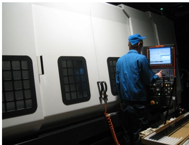
MC マシニングセンタ技術者