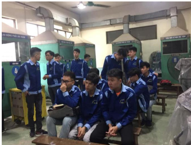
ベトナム現地にて技術者を面接

■ベトナム進出コンサルタント ■ベトナム語の通訳・翻訳 ■ベトナム商品の輸入・販売