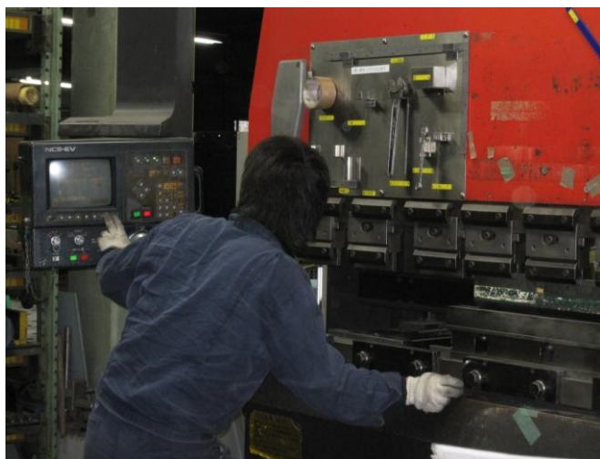
高度な技術の機械加工・製造技術者