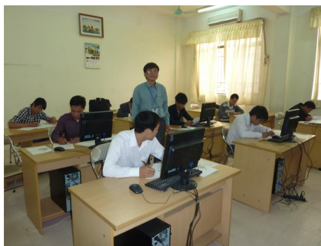
STEP② 日本語学習、入国許可申請