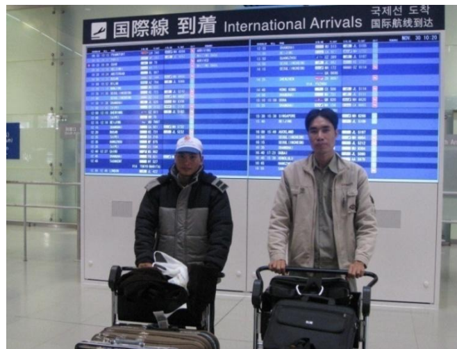
技術者が日本へ入国