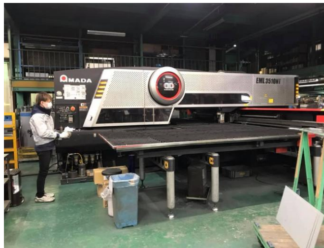
NC プログラミング技術者