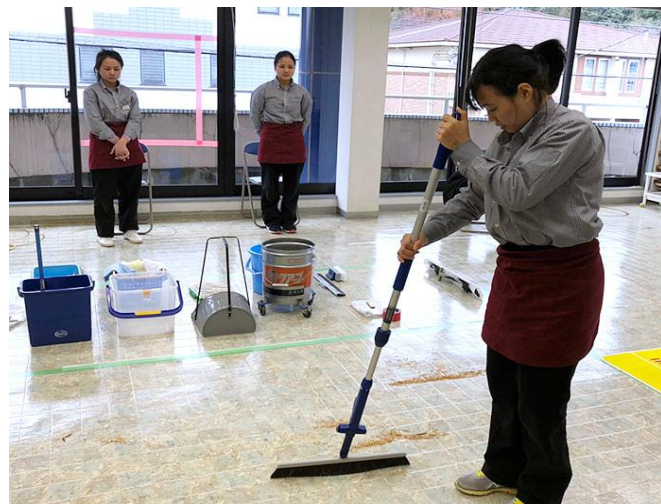
ビルクリーニング