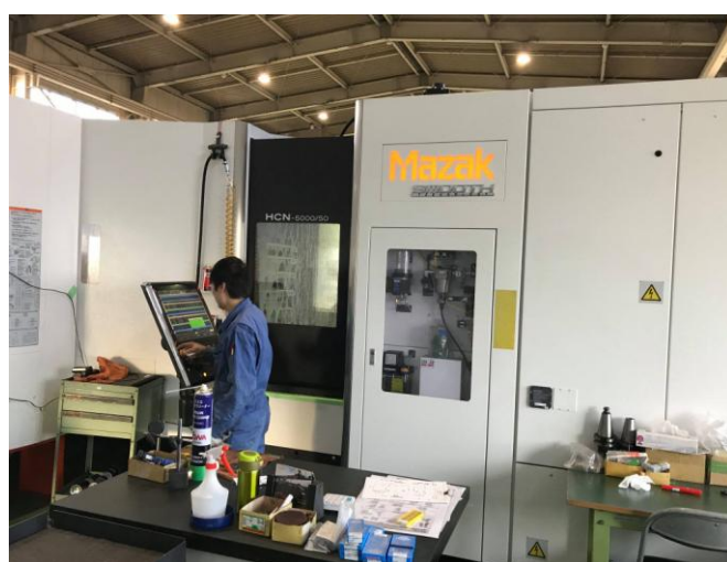
MC オペレーター技術者