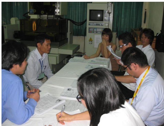
STEP① 技術者を面接・選定

STEP ①技術者を面接選定⇒②日本語学習・入国許可申請⇒③技術者入国⇒④仕事スタート