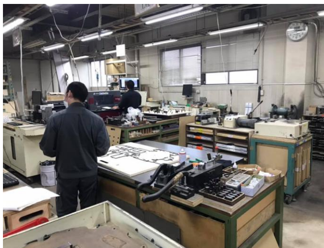
STEP④ 企業様にて仕事をスタート