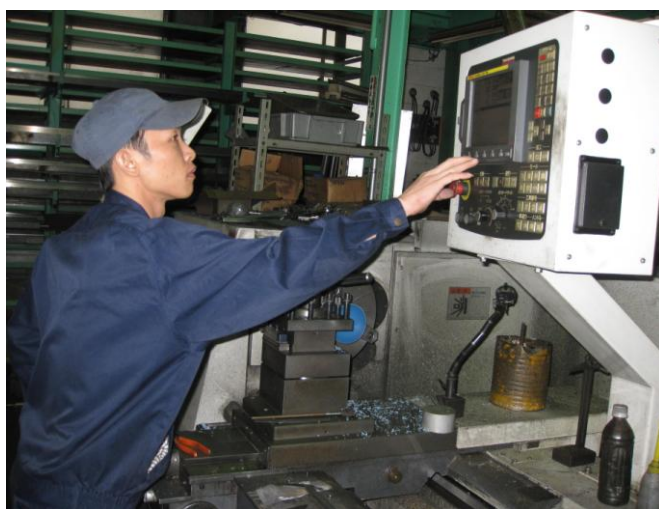
NC プログラミング技術者