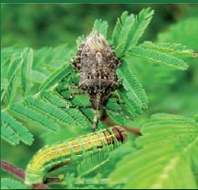
Figura 7. Pentatomidae