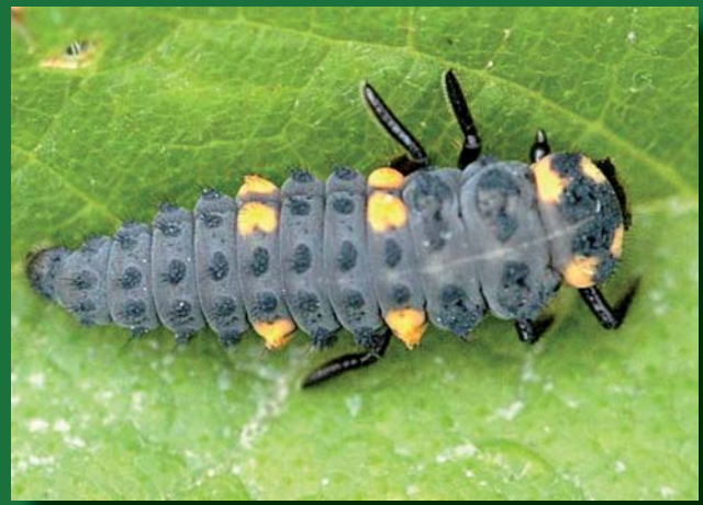
Adulto y larva de Coccinella septempunctata