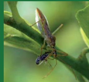
Figura 9. Reduviidae