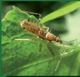
Figura 8. Nabidae