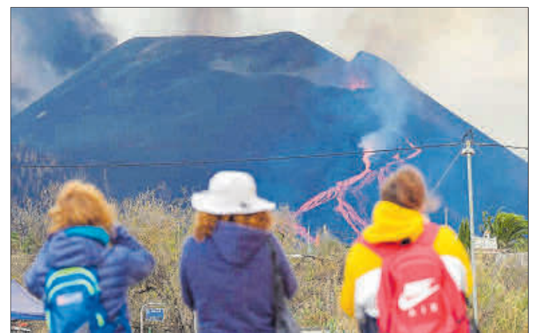
Derrumbe parcial del cono principal del volcán.

Torres completó esa afirmación ayer, al recordar que proteger con carácter ambiental los suelos cubiertos por la lava es algo que compete decidir al Gobierno canario, y no lo ha hecho.