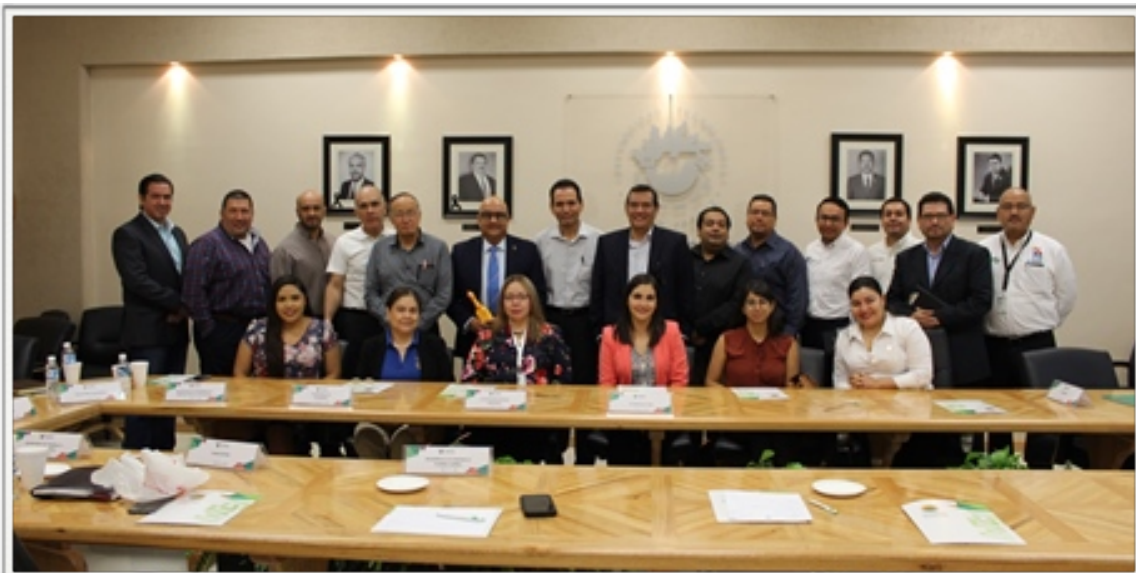
Participating in El Consejo de Vinculación y Pertinencia (CVyP)