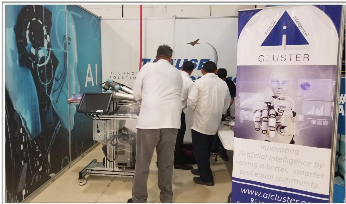
TAMUSE Systems (members of Ai Cluster)