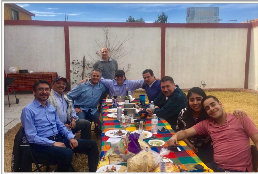
A summer time with Ai Cluster members