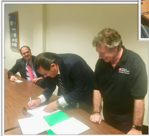
Signing MOU with NMSU (New Mexico State University)