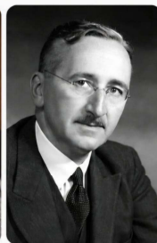
Friedrich August von Hayek (1899–1992)