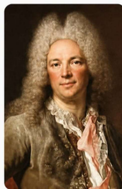
Richard Cantillon (1680s–1734)

Einflussreiche Denker der Ökonomie – gestern, heute und für die Zukunft