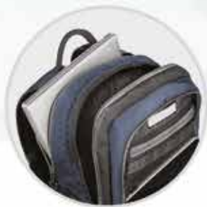
PROTECCIÓN ACOLCHADA para una laptop y una tablet