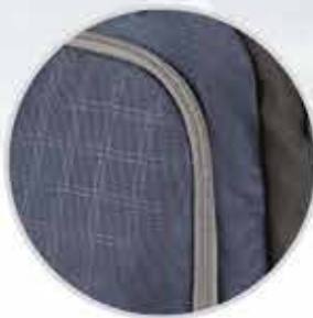
TEJIDO DURABLE VERSATEK en el cuerpo principal extraordinariamente resistente al desgaste por fricción