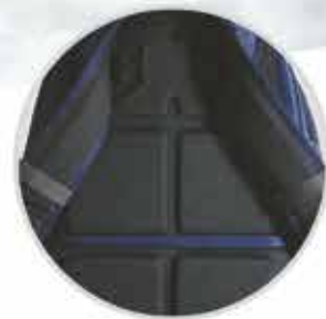
PANELES DORSALES Y CORREAS DE HOMBRO MOLDEADOS POR COMPRESIÓN que ofrecen un confort superior durante el uso prolongado