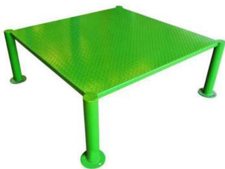
CNo7 APARATO CANINO MESA Medidas: 1.24 x 1.24 x .45h m