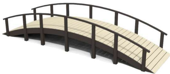
CN18 PUENTE Medidas: 6.00 x 1.5 x .70h m