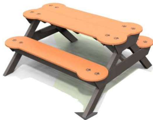
CN24 BANCA DE PICNIC HUESO Medidas: .33 x .82 x 1.30h m