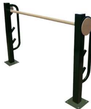
CNo4 APARATO CANINO VALLAS Medidas: 1.36 x .19 x .78h m