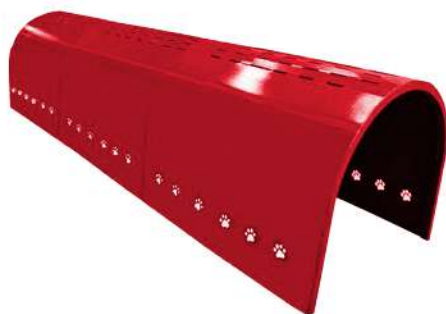
CNo3 APARATO CANINO TÚNEL Medidas: 2.48 x .62 x .61h m