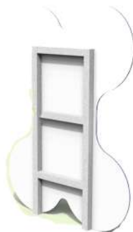
CN19 SEÑALETICA HUESO Medidas: 1.20 x .06 x 1.60h m