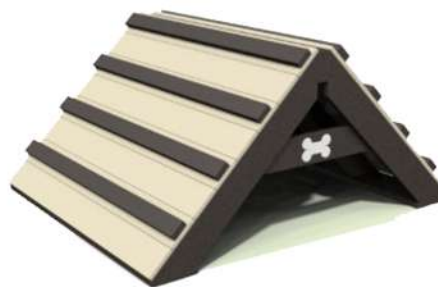
CN09 RAMPA CHICA Medidas: 1.20 x 1.00 x .60h m