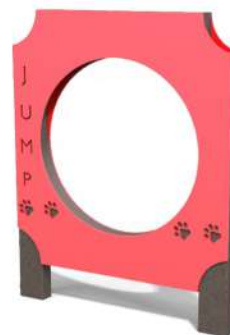
CN22 PANEL DE SALTO Medidas: .07 x .81 x 1.04h m