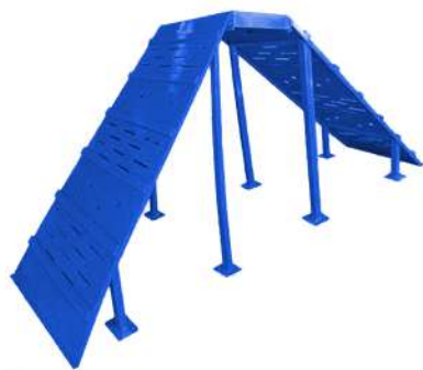
CNo1 APARATO CANINO RAMPA Medidas: 2.84 x .91 x 1.44h m

Fabricados de acero con pintura electrostática