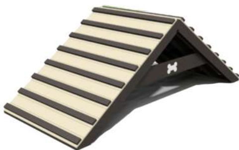
CN10 RAMPA GRANDE Medidas: 2.5 x 1.10 x .90h m