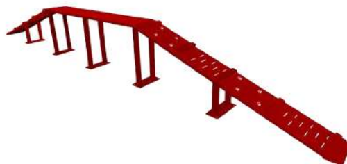
CNo2 APARATO CANINO PASARELA Medidas: 6.16 x .32 x .71h m