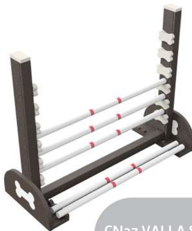
CN27 VALLA SALTO MADERA PLÁSTICA 1.04 x .40 x .83h cm