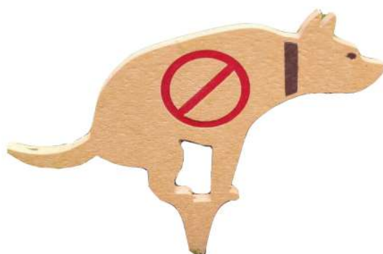
CN26 SEÑALETICA NO POOP Medidas: .43 x .01 x .43h m