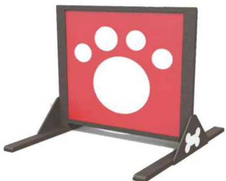
CN21 PANEL DE SALTO HUELLA Medidas: 1.60 x 1.40 x 1.40h m