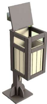
CN23 BOTE DE BASURA PRIVANZA CON DISPENSADOR DE BOLSAS Medidas: .33 x .82 x 1.30h m