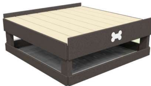
CN11 BANCA DE PRESENTACIÓN Medidas: 1.20 x 1.20 x .40h m