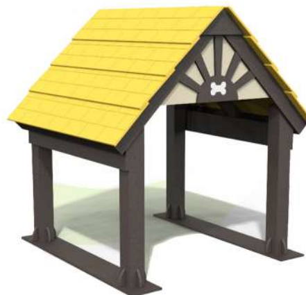
CN16 TÚNEL TIPO CASA Medidas: 1.40 x 1.48 x 1.55h m