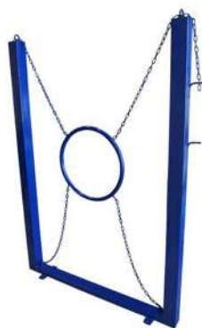
CNo5 APARATO CANINO ARO Medidas: 1.12 x .08 x 1.60h m