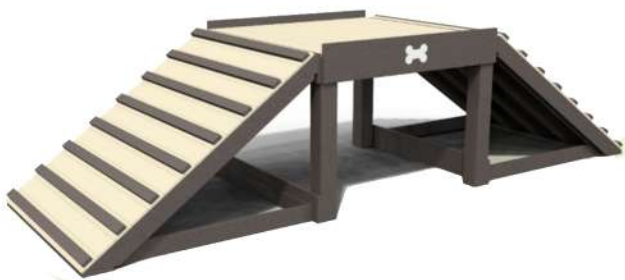
CN08 RAMPA DOBLE CON PUENTE Medidas: 3.75 x 1.20 x .90h m