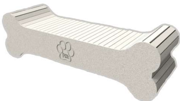
CN25 BANCA HUESO Medidas: 2.00 x .60 x .58h m