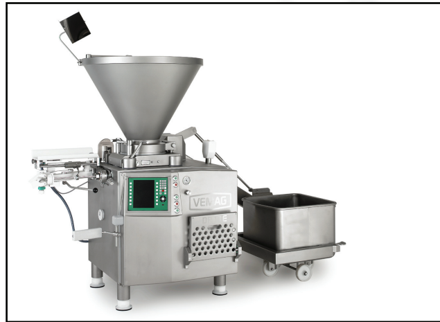
DP14E mit DHV841