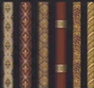
COLUMN AND RIB DETAIL