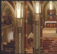
NAVE SIDE AISLE