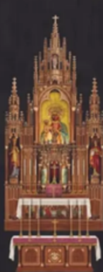
SANCTUARY AND NAVE FITMENTS