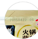
Bolsas de alimento