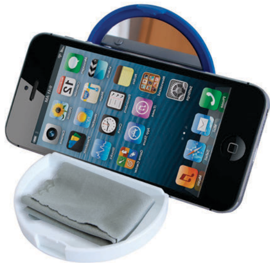
Espejo porta celular con pañó de limpieza