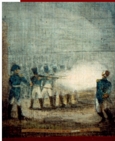
Fusilamiento de Agustín de Iturbide, óleo sobre tela, 1966, Antonio González Orozco, Museo Nacional de Historia, Castillo de Chapultepec, México.

hubiera algún tipo de actividad económica, ni movimientos migratorios, menos, asentamientos regulares o irregulares registrados.