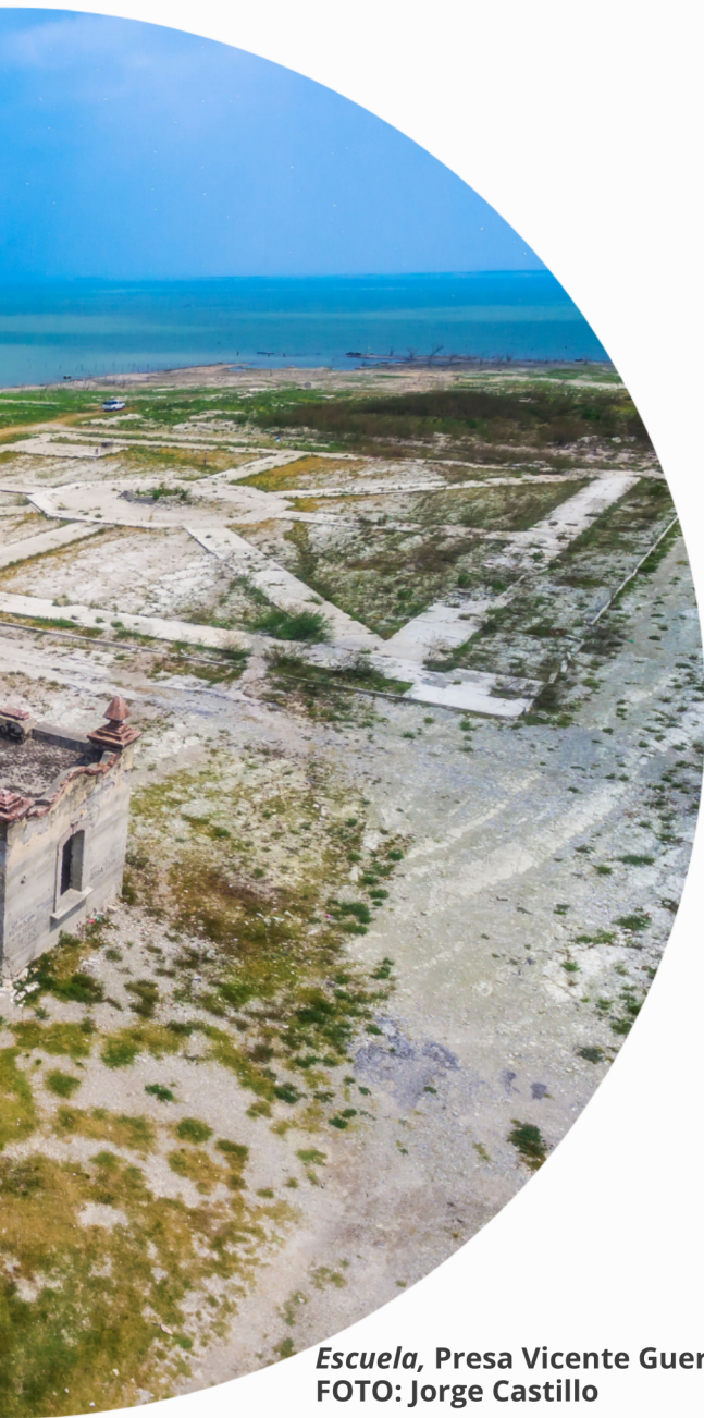
Escuela, Presa Vicente Guerrero.

de Santander arrasaran con los indígenas nómadas que habitaban estas tierras ante su renuencia a ser asimilados por costumbres y estilos de vida distintos a los suyos, todo en el afán de colonizar tierras que ya eran utilizadas por ganaderos de las áreas vecinas como los ahora estados de Nuevo León y San Luis Potosí.