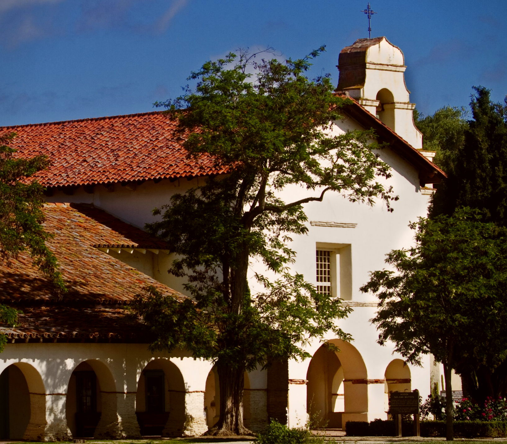
Misión de San Juan Bautista, California.