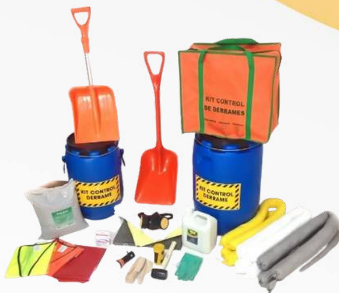
KIT DE DERRAMES