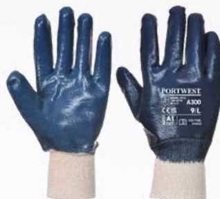
A300 NITRILO PUÑO CERRADO