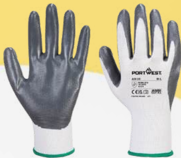
A310 NYLON NITRILO