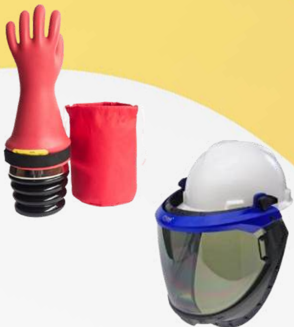
DIELECTRICOS E IGNIFUGOS