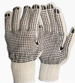
A113 HILAZA PUNTOS PVC