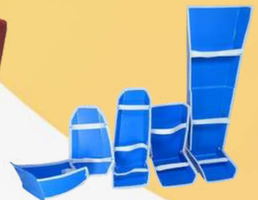
KIT CARTON PLAST