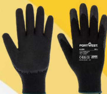
A150 HILAZA LATEX