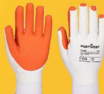
A135 HILAZA LAMINADO