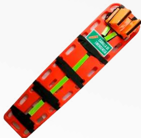
CAMILLAS Y ACCESORIOS