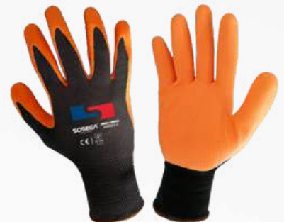
CRISS CROSS NITRILO