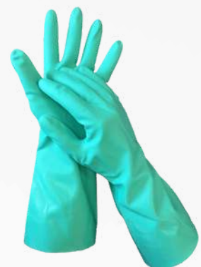
NITRILO LARGO Y CORTO