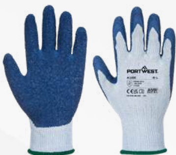
A100 HILAZA LATEX