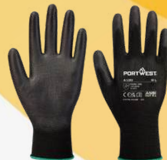
A120 NYLON PU