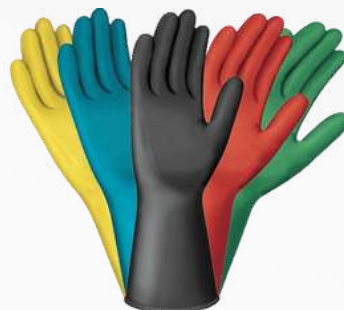
CAUCHO CAL. 25-35-50