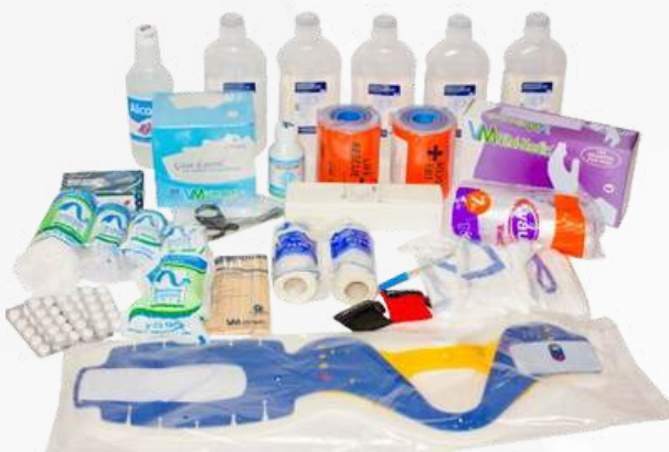
DOTACIONES PARA BOTIQUIN