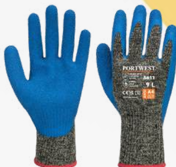
A611 ANTICORTE NITRILO