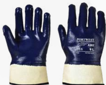
A302 NITRILO PUÑO ABIERTO