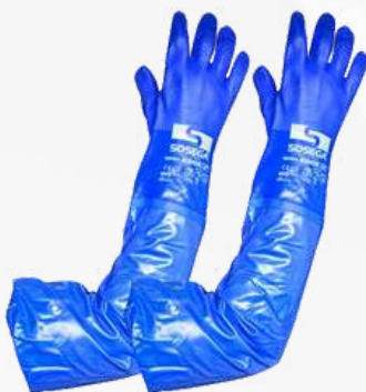
PVC AL HOMBRO