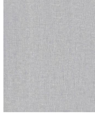
HZ04- GRIS JIAN