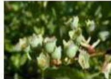
Crecimiento de frutos y brotes