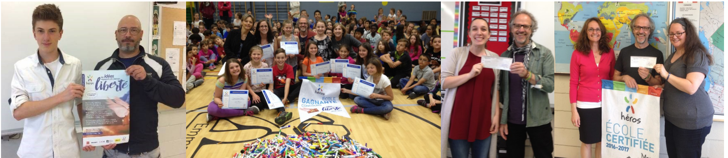
École secondaire Liberté-Jeunesse