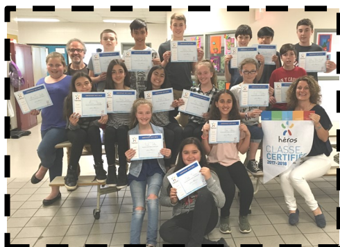
École du Mai