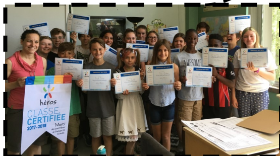
École de l'Harmonie-Jeunesse