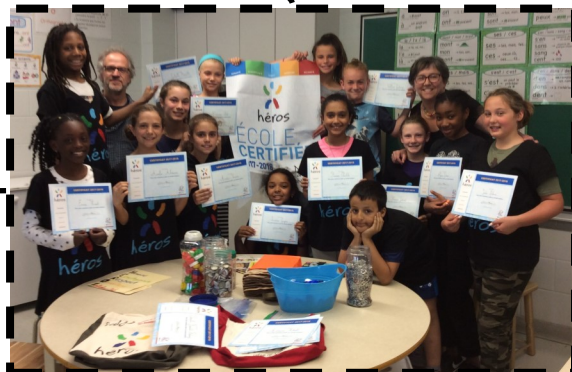
École Jeunes du Monde