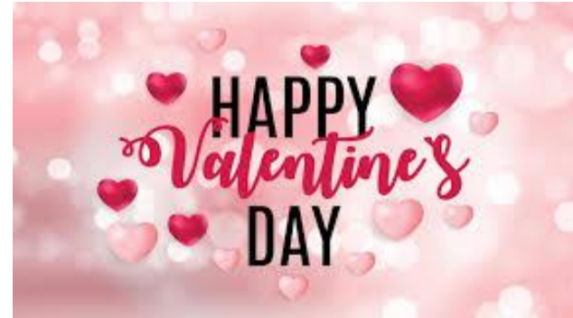
Feliz día de San Valentín