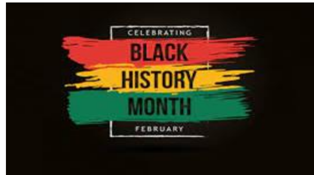
Mes de la Historia de la Raza Negra