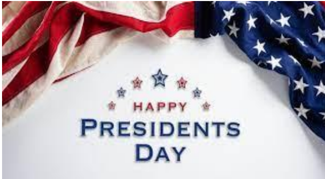
Feliz Día de los Presidentes