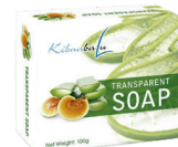
Jabón Transparente NSOC37794-18PE

Presentamos nuestra gama de productos, todos enriquecidos con extracto de Ganoderma lucidum