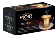
PIOIR Mocha Rico P2973921E/NAGNIO