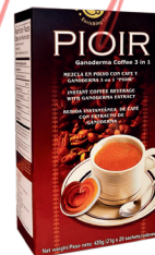
PIOIR Café 3en1 Q0400413E/NAGNIO