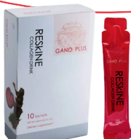
Reskine Colágeno P2974021E