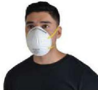
HY8810 Mascarilla Desechable N95 8710 (20 Piezas)