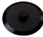
MM-7283 Válvula de Exhalación (10 Piezas)