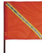
SE-BA06-R Banderole de Seguridad con Reflejante