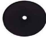
MM-7282 Válvula de Inhalación (10 Piezas)