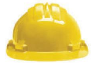
SE-CA03 Casco de Seguridad Amarillo