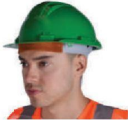
SE-CA04 Casco de Seguridad Verde