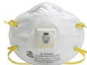
MM-8210-V Respirador N95 (10 Piezas)