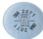
MM-2071 Filtro para Partículas (2 Piezas)