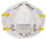
MM-8210 Mascarilla 3M 8210 (20 Piezas)