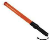
SE-BS Bastón Luminoso de Seguridad