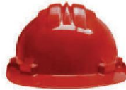
SE-CA01 Casco de Seguridad Rojo