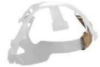
SE-CS Suspensión para Casco de Seguridad