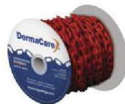
SE-CADENA-R Cedene Plástica Roja c/ 50 mts 6mm