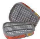
MM-6009 Cartucho para Vapores de mercurio (2 Piezas)