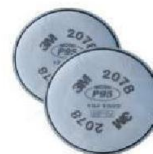
MM-2078 Filtro para Gases Ácidos y Vapores Orgánicos