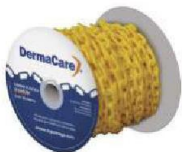
SE-CADENA Cedene Plástica Amarilla c/ 50 mts 6 mm