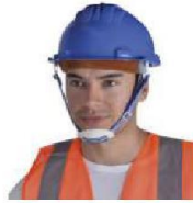
SE-BA Barbiquejo para Casco