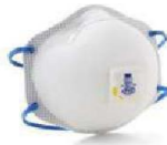
MM-8271 Respirador para Partículas (10 Piezas)