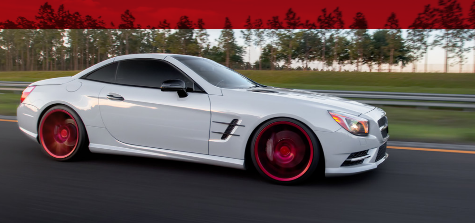
color: 313M matte copper kiss // front cover Carbon Wraps // color: 711 gloss stone grey // back cover

Premium Wrapping Cast | Premium Shift Effect Cast | Premium Special Effect Cast