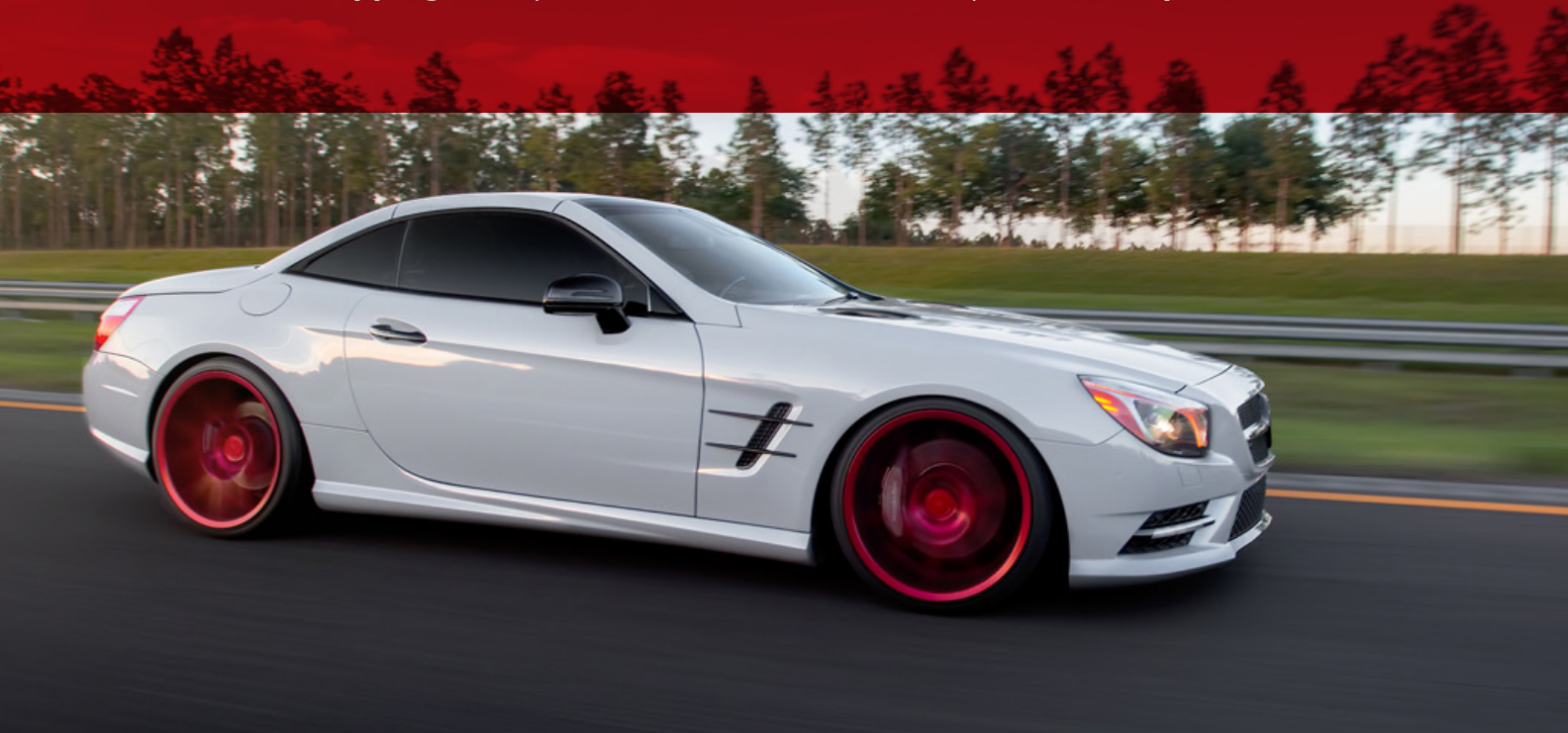
Photos courtesy of /// Luke Terry (photographer), Unleashed Motorsports - Fresno, CA (installation) /// color: 313M matte copper kiss /// front cover Carbon Wraps /// color: 711 gloss stone grey /// back cover

Premium Wrapping Cast | Premium Shift Effect Cast | Premium Special Effect Cast