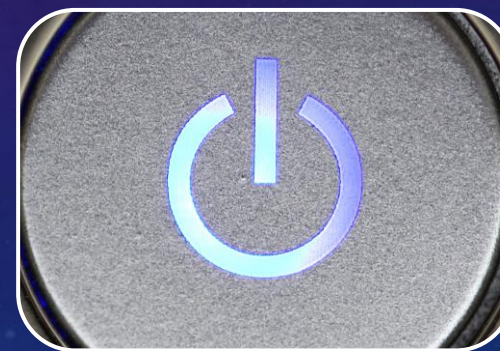
Implementación de metodología electoral