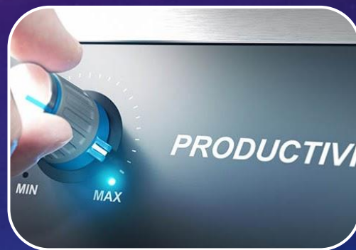
Uso de economías a escala