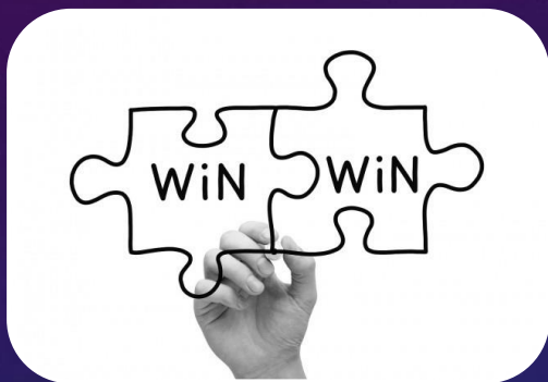
Mayor tasa de victorias