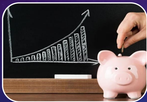
Optimización de recursos