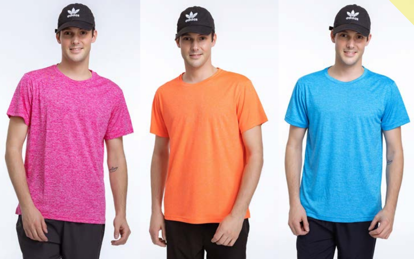
吸濕排汗短袖 T 恤 售價 $750 吸濕排汗短袖 T 恤 售價 $750 吸濕排汗短袖 T 恤 售價 $750 1972-5 玫瑰紅 1972-6 橘色 1972-7 水藍色 ▪ 聚酯纖維 100% (吸濕排汗原紗) ▪ 聚酯纖維 100% (吸濕排汗原紗) ▪ 聚酯纖維 100% (吸濕排汗原紗)