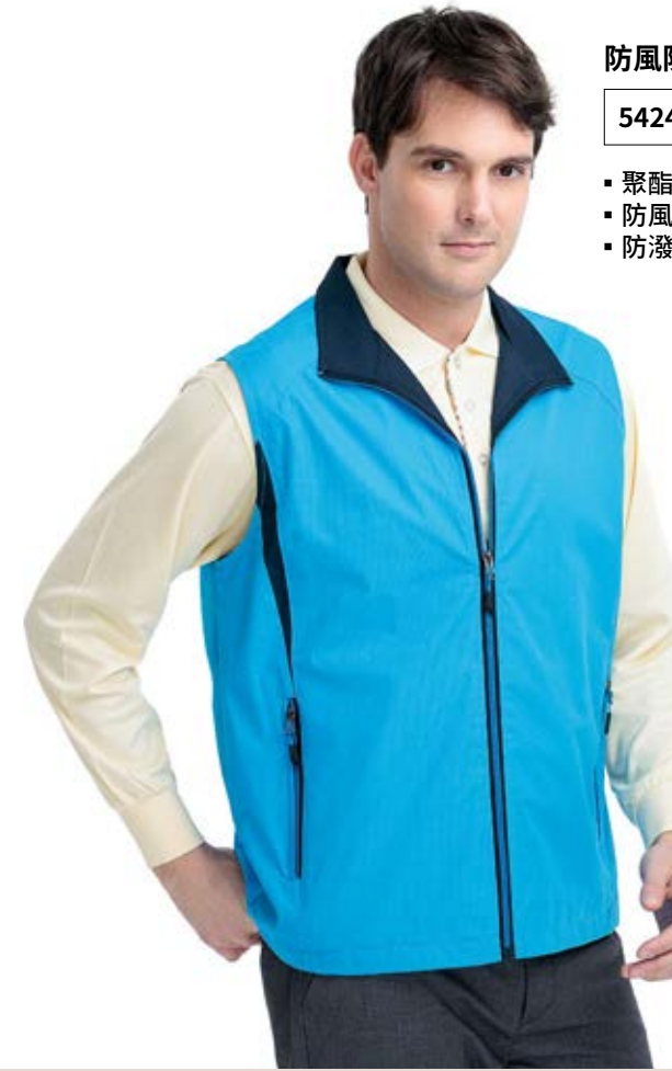
防風防水網裡背心 售價 $1400