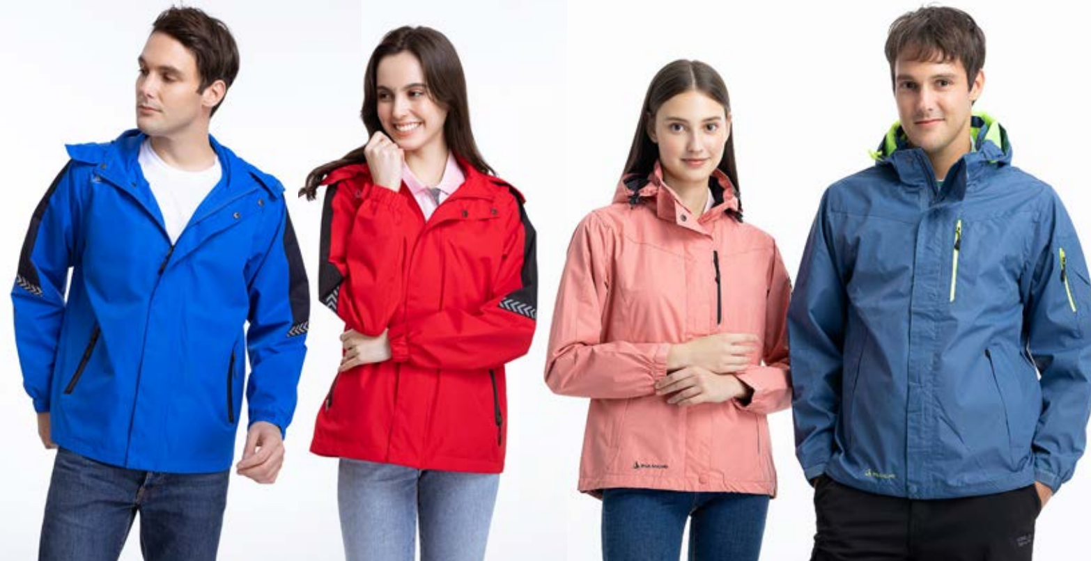
女款 防水透濕網裡機能外套