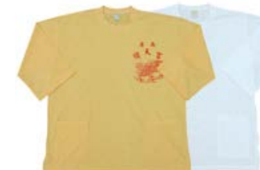
七分袖 售價 $725