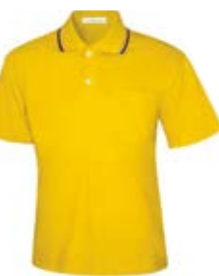
TC 短袖 POLO 衫