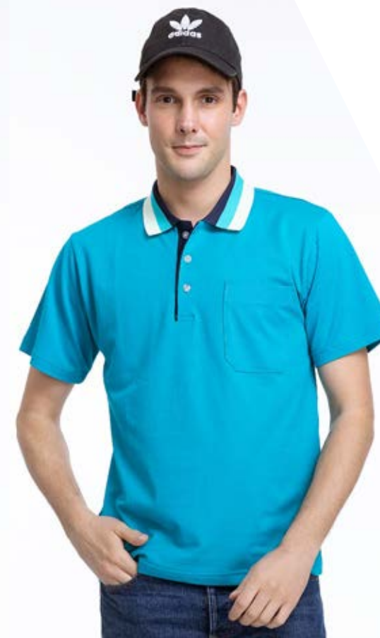
女款 - 快乾棉排汗短袖 POLO 衫