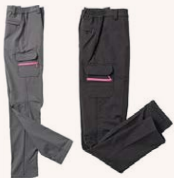
女款 / 高彈力機能軟殼長褲