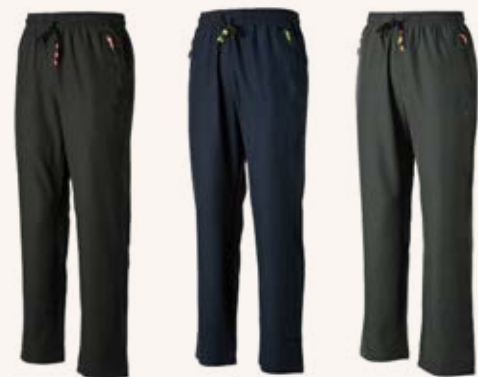
超彈力吸濕排汗長褲 售價 $1250