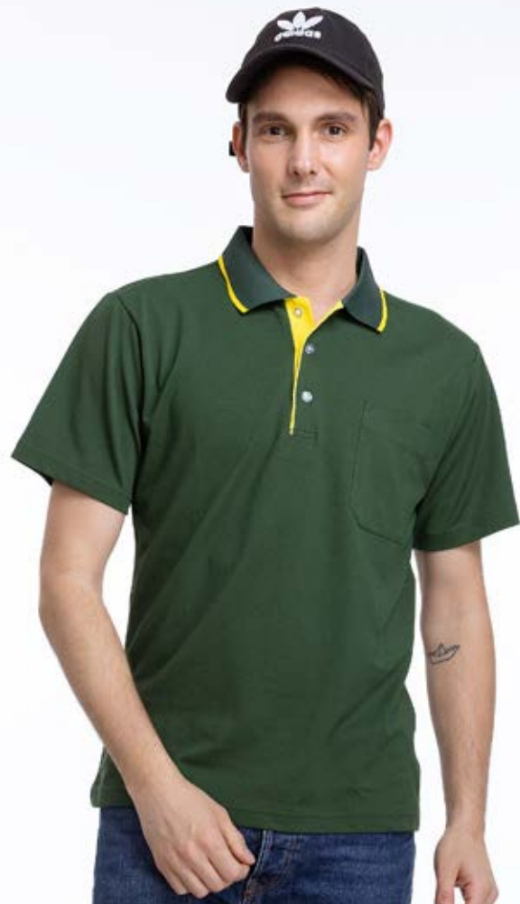
快乾棉排汗短袖 POLO 衫