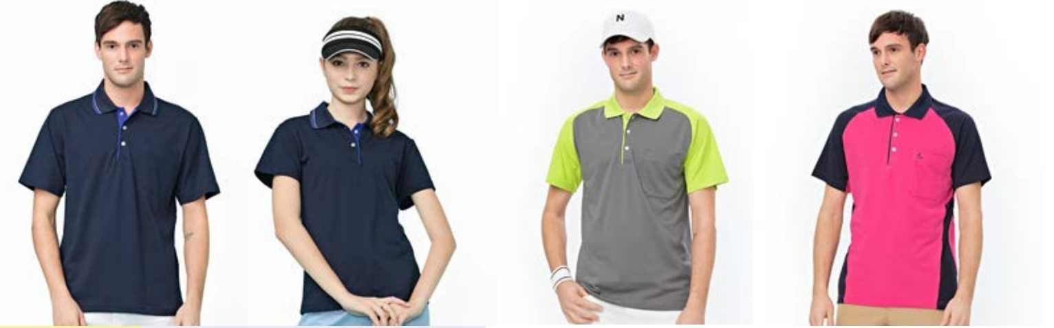
CVC 短袖 POLO 衫 女款 - CVC 短袖 POLO 衫 快乾棉排汗短袖 POLO 衫 快乾棉排汗短袖 POLO 衫 1048-2 丈青色 1058-2 丈青色 1981-3 灰色 1824-3 丈青 | 桃紅 ▪ 天然棉 60% ▪ 天然棉 60% ▪ 天然棉 51.2% ▪ 天然棉 51.2% ▪ 聚酯纖維 40% ▪ 聚酯纖維 40% 聚酯纖維 48.8% (吸濕排汗原紗) 聚酯纖維 48.8% (吸濕排汗原紗) 售價 $900 售價 $900 售價 $1200 售價 $1150