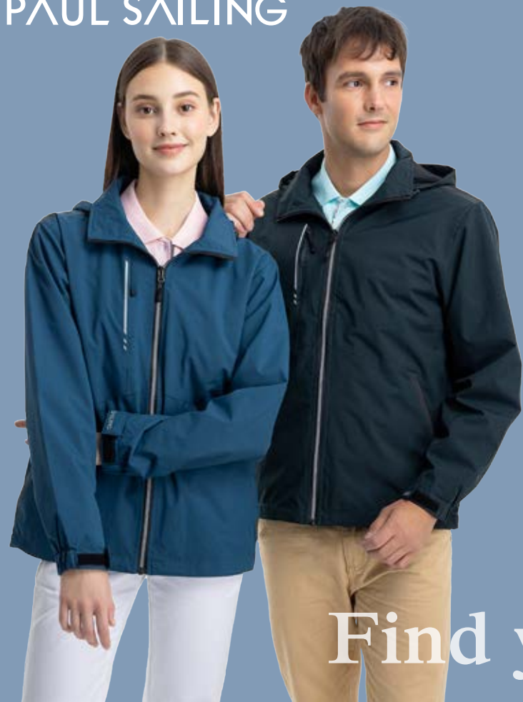
防水透濕網裡機能外套 | 帽子可收納