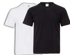
純棉短袖 T 恤 售價 $650