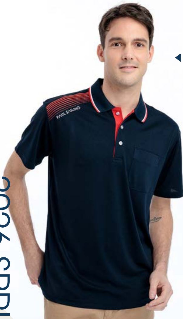
◀ 吸濕排汗短袖 POLO 衫