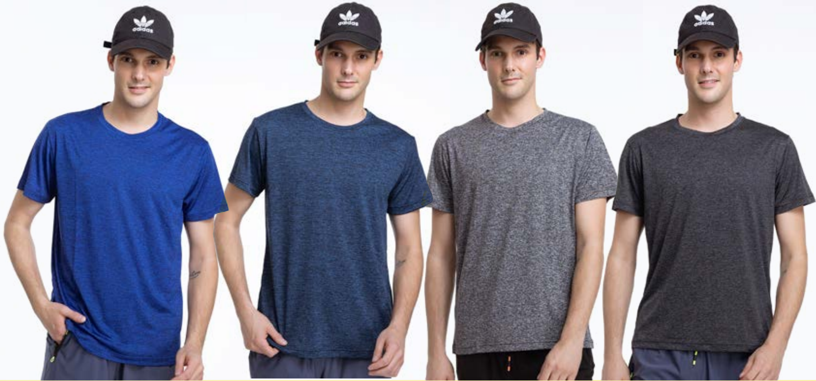
吸濕排汗短袖 T 恤 售價 $750 吸濕排汗短袖 T 恤 售價 $750 吸濕排汗短袖 T 恤 售價 $750 吸濕排汗短袖 T 恤 售價 $750 1972-4 深藍色 1972-3 丈青色 1972-2 深灰色 1972-1 黑色 ▪ 聚酯纖維 100% (吸濕排汗原紗) ▪ 聚酯纖維 100% (吸濕排汗原紗) ▪ 聚酯纖維 100% (吸濕排汗原紗) ▪ 聚酯纖維 100% (吸濕排汗原紗)