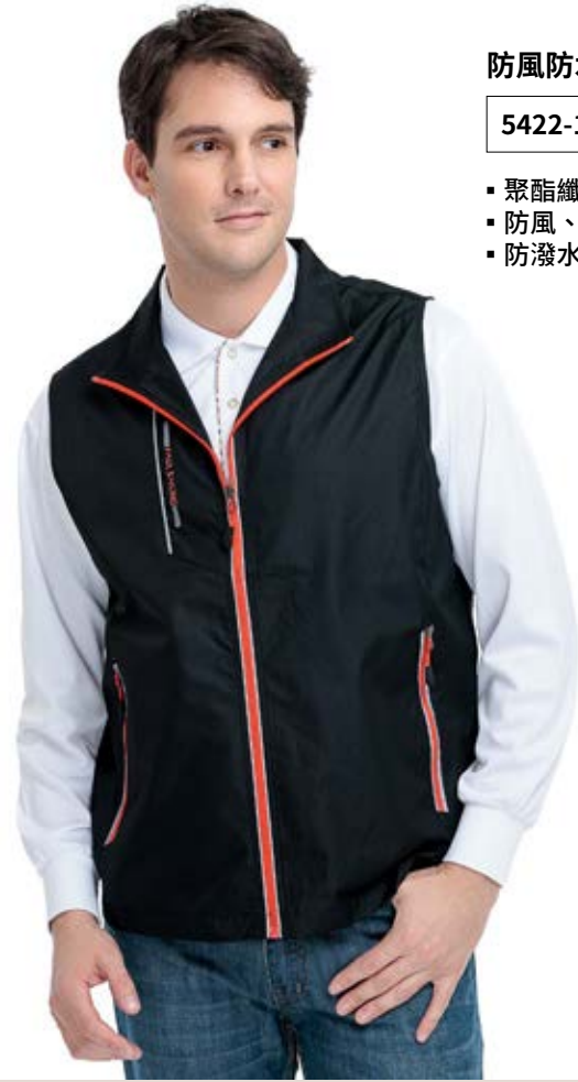
防風防水網裡背心 售價 $1400