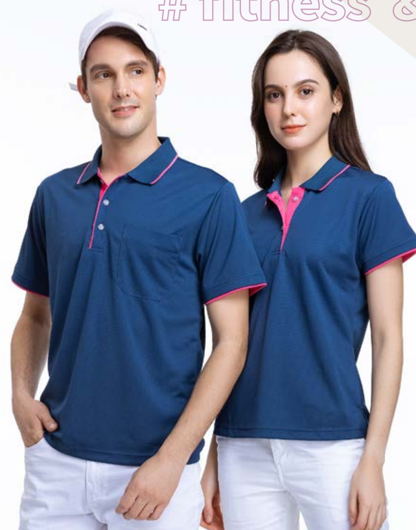
吸濕排汗短袖 POLO 衫