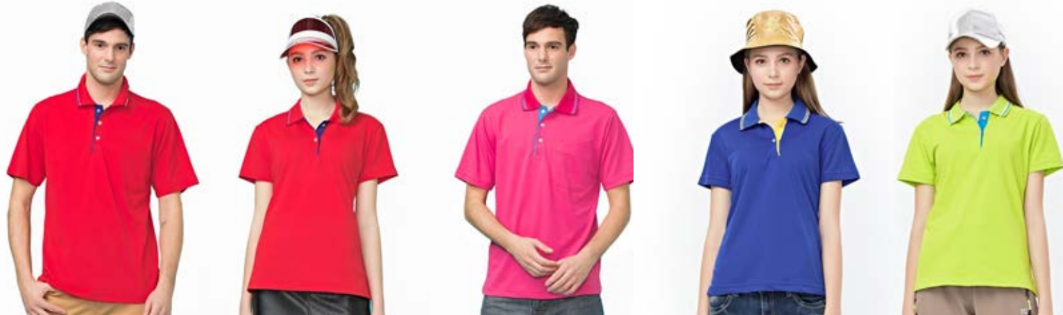
CVC 短袖 POLO 衫 女款 - CVC 短袖 POLO 衫 CVC 短袖 POLO 衫 女款 - CVC 短袖 POLO 衫 女款 - CVC 短袖 POLO 衫 1048-4 大紅色 1058-4 大紅色 1048-5 桃紅色 1058-6 寶藍色 1058-3 蘋果綠 ▪ 天然棉 60% ▪ 天然棉 60% ▪ 天然棉 60% ▪ 天然棉 60% ▪ 聚酯纖維 40% ▪ 聚酯纖維 40% 聚酯纖維 40% 聚酯纖維 40% 售價 $900 售價 $900 售價 $900 售價 $900 售價 $900