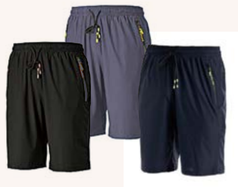
超彈力吸濕排汗五分褲 售價 $1180