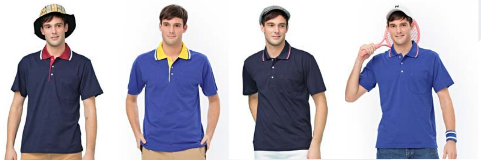
純棉短袖 POLO 衫 純棉短袖 POLO 衫 C+T 網眼短袖 POLO 衫 C+T 網眼短袖 POLO 衫 1913-2 丈青色 1913-5 寶藍色 1792-4 寶藍色 1792-2 丈青色 ▪ 天然棉 100% ▪ 天然棉 100% ▪ 天然棉 60% ▪ 天然棉 60% 售價 $1100 售價 $1100 聚酯纖維 40% 售價 $1000 售價 $1000