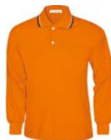
TC 長袖 POLO 衫