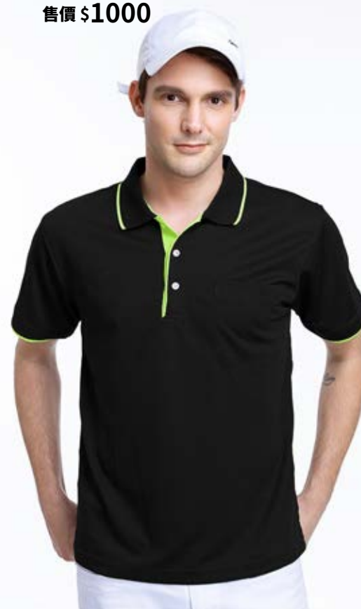
吸濕排汗短袖 POLO 衫