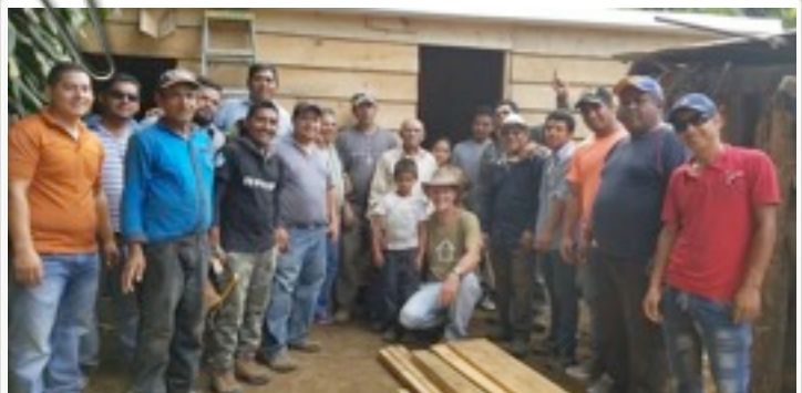
We continue to build lives, one family at a time...construyendo vidas, una familia a la vez

We are celebrating our sixth anniversary in the Open Door Church January 7, and have a membership of around 400. The Hosanna School is growing and will top 400 in January. Thanks for your prayers and support!