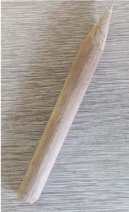
Abb. 5: Holta-Stick