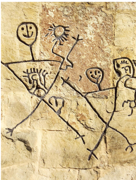
Abb. 6: Seelenstein „Freude“ der Chibcha-Muisca in Cajica, Kolumbien

Die negativen Grundemotionen, die den Seelen-Print Punkt kennzeichnen, sind Ärger und Wut. Erkrankungen, welche in diesem Zusammenhang auftreten können, sind: Multiple Sklerose, Fibromyalgie, Depressionen und Süchte.