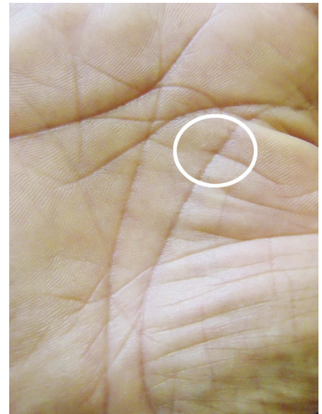
Abb. 3: Kombiniertes Seelen-Print Punkt und Strich

den Stirnlinien sich abbildenden Seelen-Prints (Akasha) sind emotionale Erinnerungen an die Erfahrungen vieler Seelenreisen. Der Soul Printer behandelt die Akash-Seelen-Prints nach der Behandlung der Hand auf die gleiche Weise.