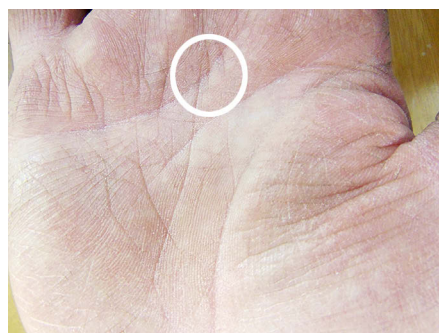
Abb. 2: Seelen-Print Strich

Die Soul Prints-Methode ist eine Hilfe, die den Weg zu diesem Ziel erleichtern kann. Positive Grundemotionen setzen keine Seelen-Prints auf den Haupthandlinien. Die auf