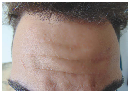
Abb. 2: Hauptstirnlinien – HSL