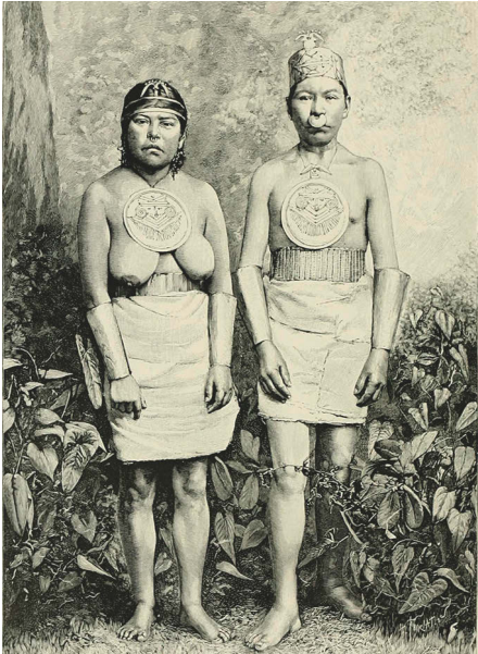
Abb. 5: Die Soul Prints sind aus der Zusammenarbeit mit indigenen Heilern der Chipcha-Muisca entstanden, die aus dem im Hochland der Anden um Bogota, der Hauptstadt Kolumbiens, stammen.

© É. Reclus: The Earth and Its Inhabitants (1882)