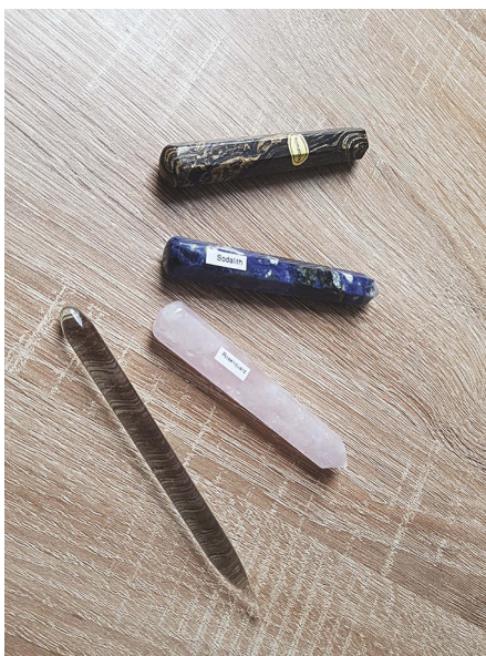
Abb. 3: Soul Print Practitioner behandeln mit natürlichen Utensilien, die auf den drei Haupt-handlinien sich abbildenden geometrischen Muster nachzeichnen.

Die Wirkung der Soul Prints findet dann unmittelbar in der Traumzeit statt. Also wenn wir schlafen. Die Soul Print Practitioner sind stets auch Traumzeitbegleiter. Die besten Ergebnisse zeigen sich, wenn der Therapeut