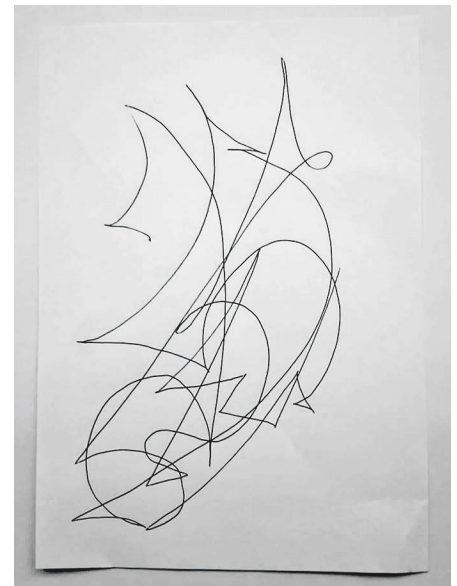
Abb. 4: Klienten können nach der Soul Print-Anwendung ein eigenes Seelenresonanz-Bild anfertigen.

Nach einigen Sekunden leichtem Schwindelgefühl – was sehr selten beobachtet wird, in diesem Fall war es allerdings so – und leichtem Kopfdruck, der auch nur ganz kurz anhielt, sagte die vor der Soul Prints-Behandlung weinende Patientin mit fester Stimme: „Ich werde noch zwanzig Jahre dort arbei-