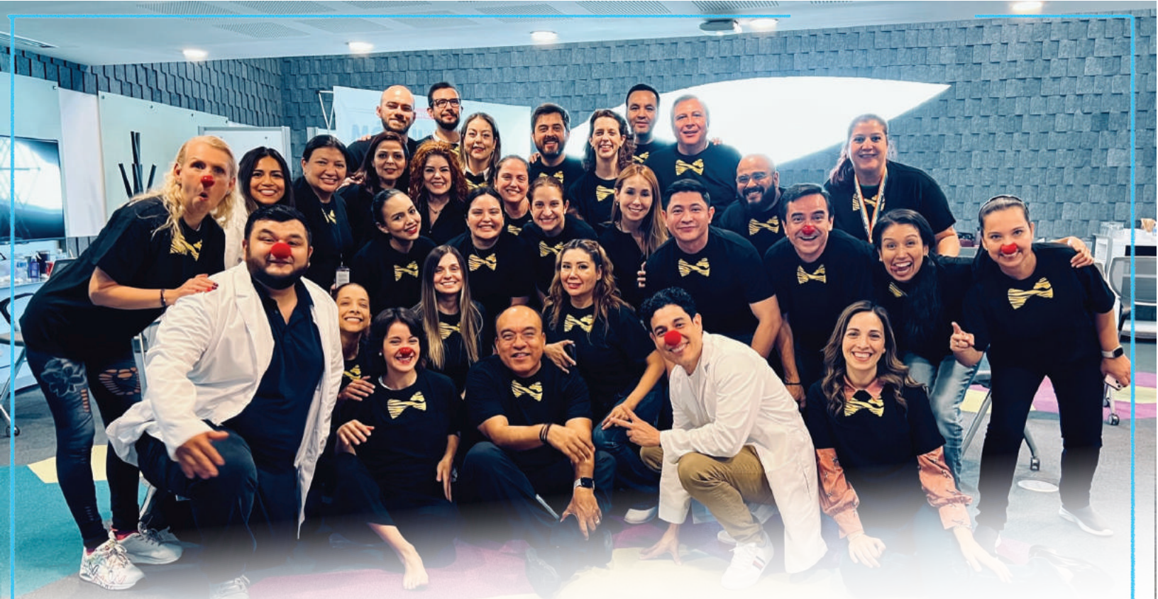
@LosTresTristesTigres visitando a la 1a. Generación de Doctores Payaso en Monterrey