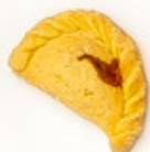
Medialuna de piña