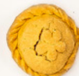
Pastel de Fresa