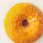
Dona de Azúcar