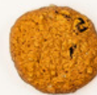
Galleta de avena