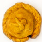
Pastel de pollo