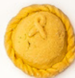
Pastel de manzana