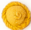
Pastel de guayaba