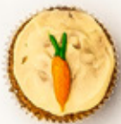
Cakito de zanahoria