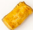
Empanada de queso