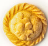
Pastel de Higo