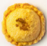
Pastel de Leche