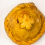
Pastel de carne