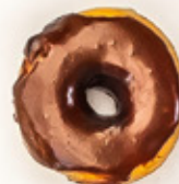
Dona de Chocolate