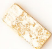
Delicia de piña