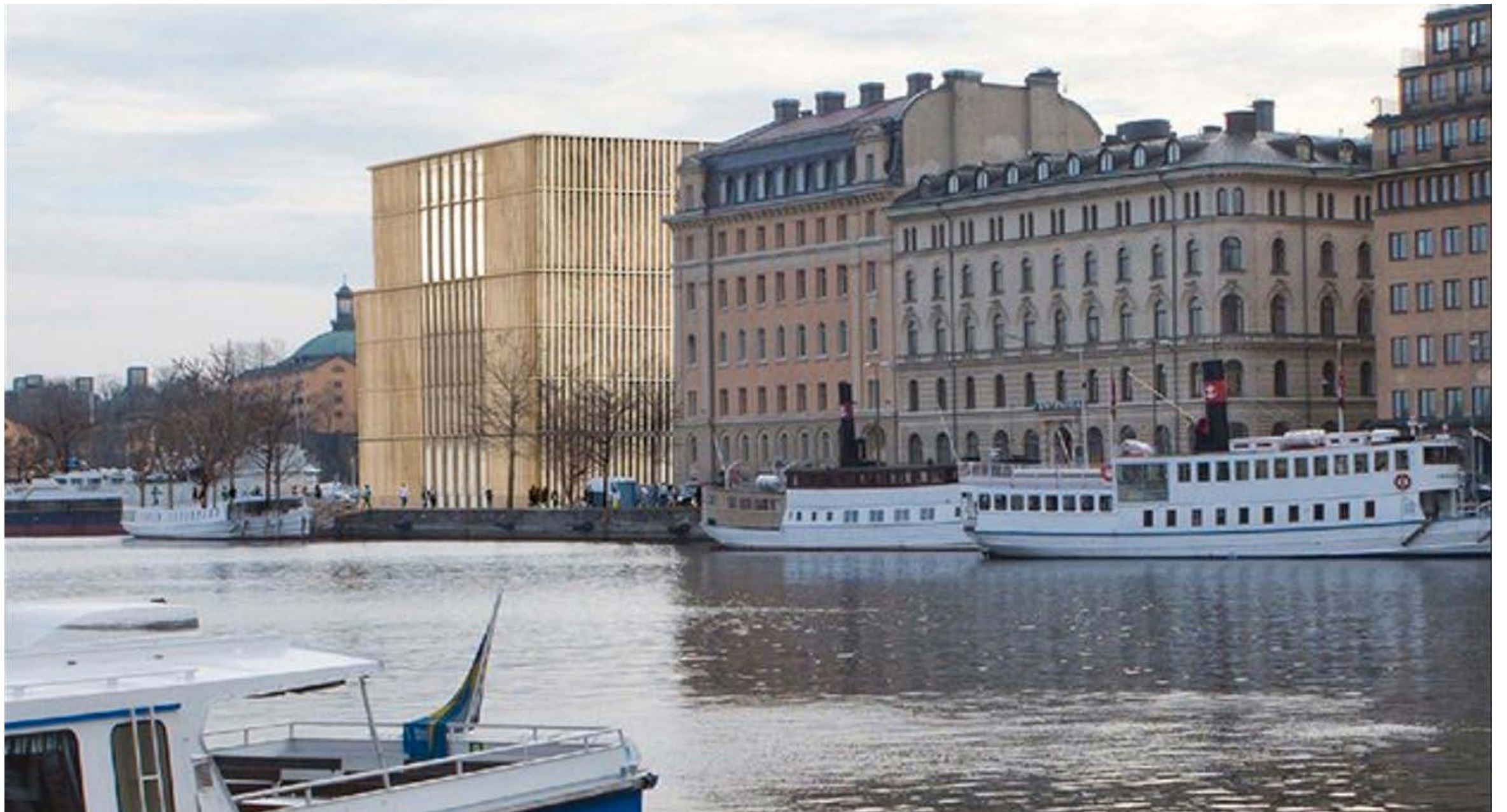
Bild: Illustration av Nobelcentret på Blasieholmen.