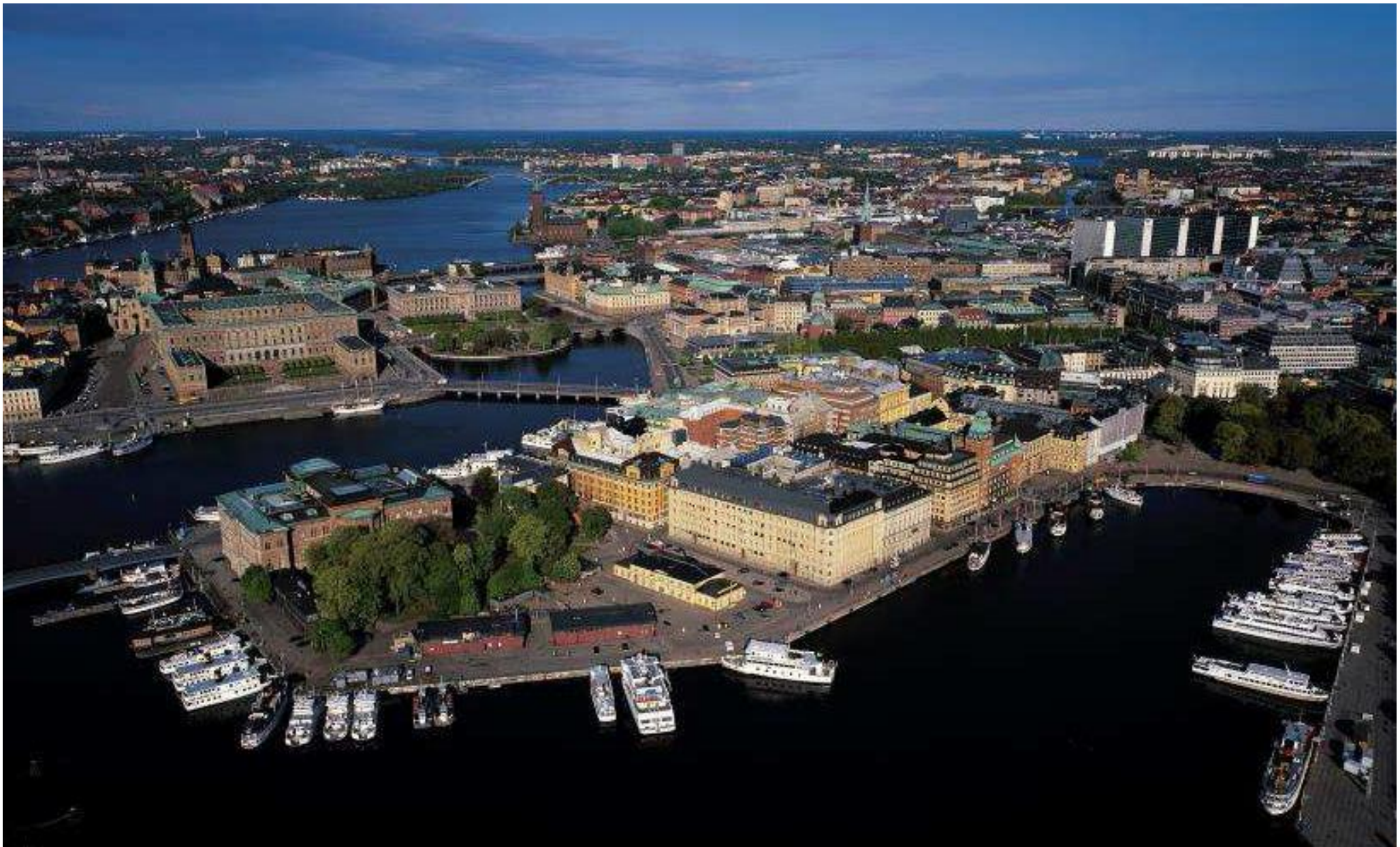
Bild: Flygfotografi över Blasieholmen där tullhuset och de två röda magasinsbyggnaderna syns i förgrunden (planbeskrivningen s. 17).