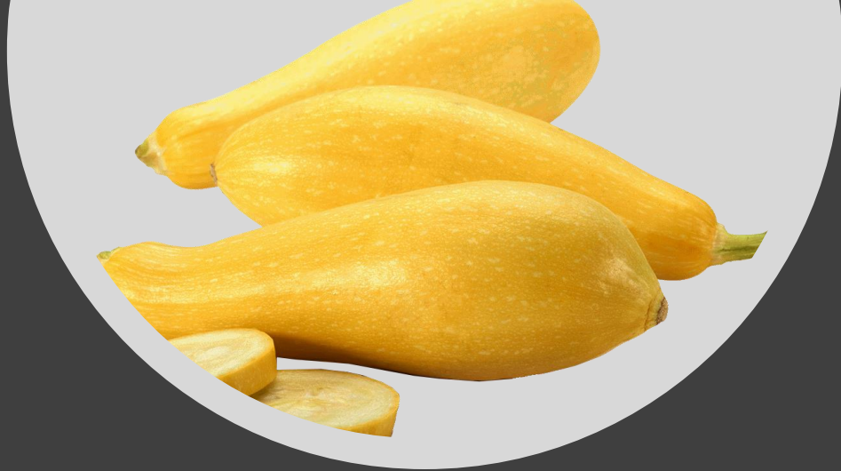
CALABACÍN AMARILLO YELLOW SQUASH