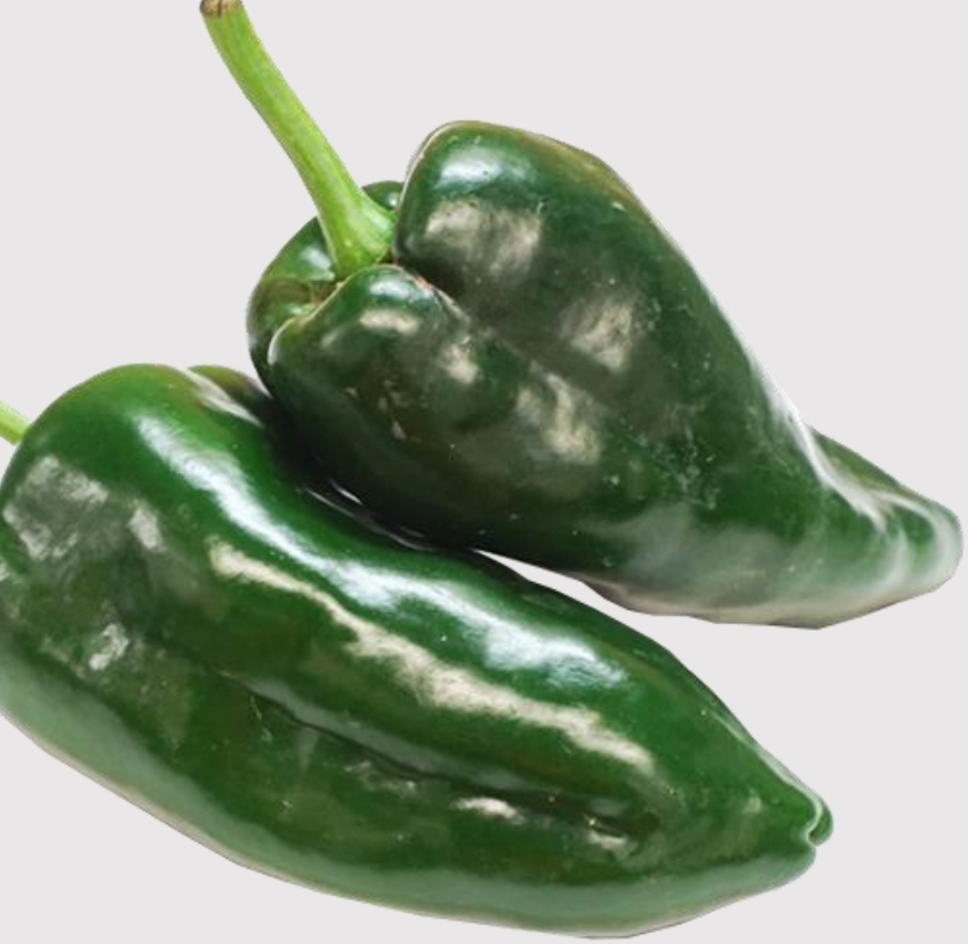
PIMIENTO POBLANO POBLANOS PEPPER