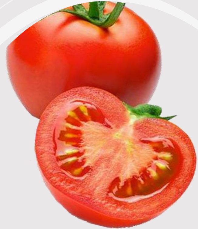
TOMATES REDONDOS ROUND TOMATOES