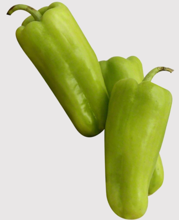
PIMIENTO CUBANELLE CUBANELLE PEPPER