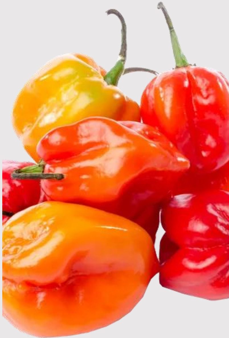
PIMIENTO (HABANERO) PEPPER (HABANEROS)