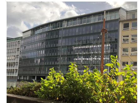
SECO Hauptsitz in Hamburg

Das Handelshaus SECO wurde 1873 für den Handel zwischen Deutschland und Japan gegründet . Durch diese japanische Verbundenheit haben wir bei SECO wichtige Geschäftstugenden verinnerlicht: Qualitätsmanagement, Genauigkeit, Flexibilität und Visionen. Getreu diesen Tugenden führen wir die Marke RuXXac erfolgreich, fair und nachhaltig.