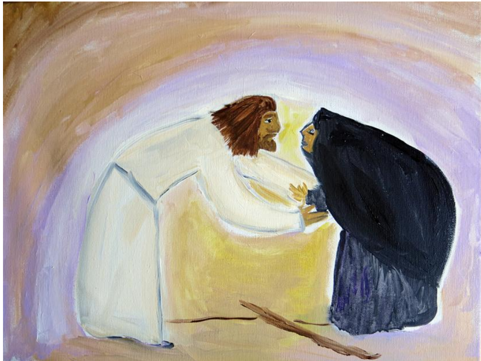
"Jesus and the Bent Over Woman" – Barbara Schwarz, OP, 2014

Prayer list is in a different PDF on the website.