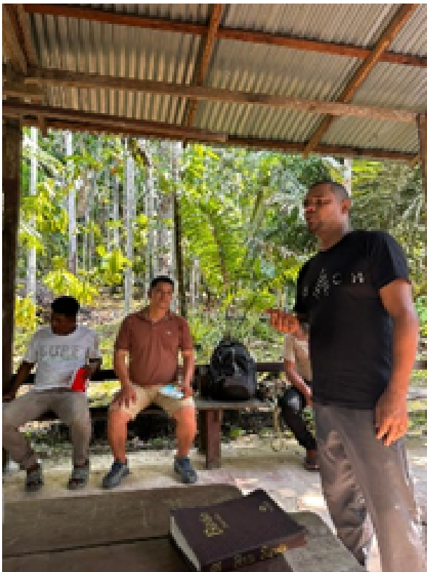
Testemunhando de Cristo, discipulando e formando líderes

Atualmente como um dos diretores de campo da Reach tenho feito esse trabalho com quatro missionários indígenas que estão plantando igrejas ao redor do Vale do Jaravi, no coração da floresta Amazônica. O Vale do Jaravi é uma das maiores concentrações de povos não alcançados pelo evangelho.