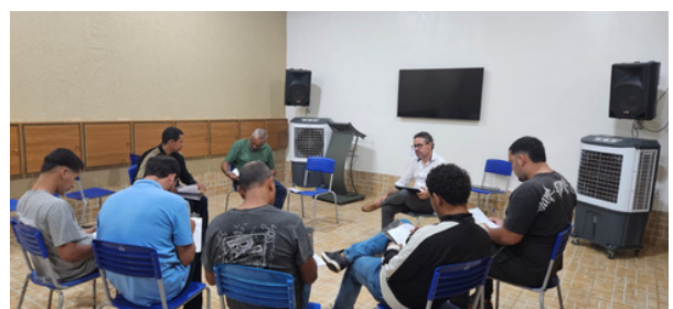
Momento de intervenção TCCG

Muitos acolhidos chegam ao programa marcados por sentimentos de culpa, rejeição e desesperança, e encontram, nesse ambiente, a possibilidade de ressignificar sua história à luz de uma nova perspectiva espiritual.