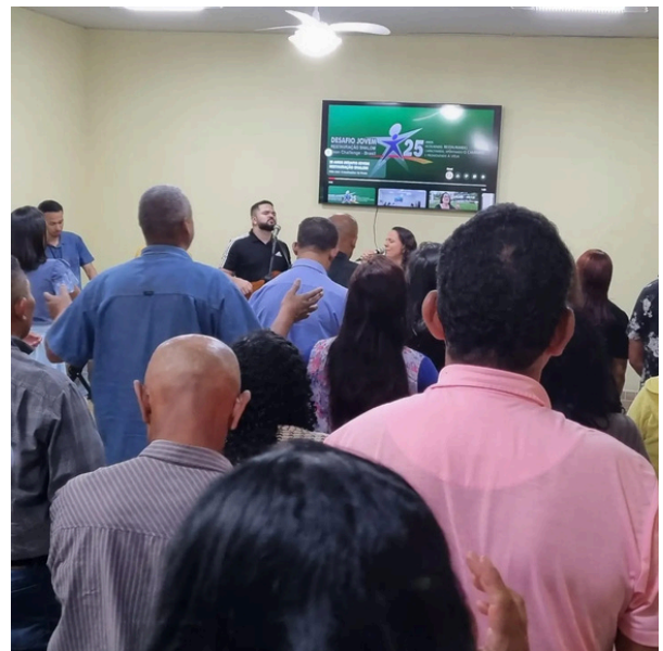
Momento devocional com os internos

Entretanto, é no eixo espiritual que o programa encontra seu diferencial mais profundo. Através dos estudos bíblicos, momentos devocionais, cultos e acompanhamento pastoral, o acolhido é conduzido a um processo de reflexão, arrependimento, reconstrução de valores e desenvolvimento de uma nova identidade. A fé cristã é apresentada como caminho de transformação, oferecendo esperança, sentido e direção.