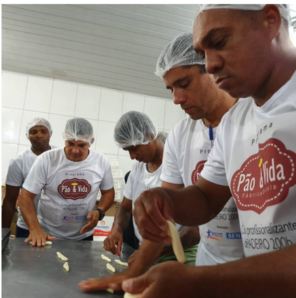
Curso profissionalizante em panificação

A rotina estruturada da comunidade favorece esse processo, promovendo disciplina, responsabilidade e compromisso. O dia a dia inclui momentos específicos dedicados ao crescimento espiritual, aliados às atividades terapêuticas e ocupacionais. Essa organização contribui para a formação de novos hábitos e para a internalização de valores que sustentam a recuperação a longo prazo. A proposta não é apenas interromper o uso de substâncias, mas formar indivíduos capazes de viver de forma saudável, responsável e com propósito.