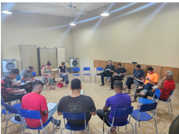
Projeto de extensão em Psicologia, desenvolvido em parceria com a Universidade Estácio de Sá – unidade Goiânia

A abordagem biopsicossocial e espiritual adotada pelo Desafio Jovem reconhece que os Transtornos por Uso de Substâncias não são apenas uma condição comportamental ou fisiológica, mas um fenômeno complexo, que envolve sofrimento emocional, rupturas sociais e, muitas vezes, um vazio existencial profundo. Por isso, o trabalho desenvolvido busca atender todas essas dimensões de forma integrada. No campo psicológico, são utilizadas intervenções baseadas em evidências, como a Terapia Cognitivo-Comportamental (TCC), auxiliando o acolhido a identificar padrões de pensamento disfuncionais e desenvolver novas estratégias de enfrentamento. No aspecto social, são promovidas ações voltadas à reinserção familiar e comunitária, bem como à capacitação profissional.