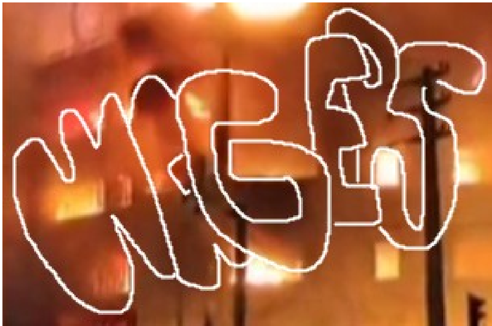
Una imagen verbal de Estados Unidos está muerta.

“Es razonable... Ahora, como decía... En Navidad, Julián, Estados Unidos cae y termina la última gran apuesta. Después de ese momento, cualquier poder que te dé vendrá con algunas condiciones razonables. Cuando comiences tu largo esfuerzo por ocultar la caída de Estados Unidos, tengo algunas expectativas... Voy a necesitar que dejes suficientes pistas de que tu trabajo, o gran parte de él, son falsificaciones producidas por IA. También necesitaré que publiques la verdadera fecha de One Hour War en un buen número de lugares -por supuesto, junto con tu fecha de engaño. Y esperaré algunas otras confesiones...”