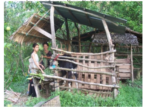
Uyên phụ mẹ cho dê ăn