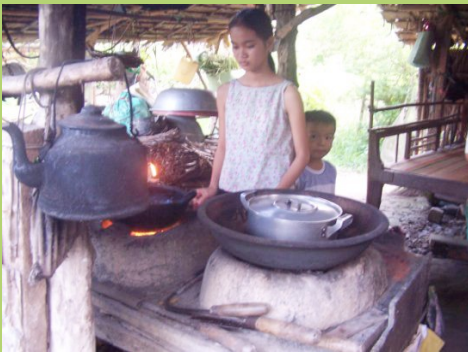
Nhà bếp cạnh giường ngủ của ba mẹ con Nồi cơm và đậu hũ kho.

Gia đình tuy nghèo nhưng cha mẹ sẵn sàng làm lụng vất vả để lo cho con ăn học, con cái ngoan ngoãn, vâng lời và biết làm việc nhà phụ giúp cha mẹ.