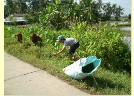
Tranh thủ vừa trông bò vừa cắt cỏ