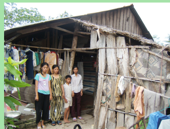
Mẹ Nhi và ba chị em

Học bổng Savice là giấc mơ của em để em được tiếp tục đi học. Em mong ước trở thành cô giáo để dạy học cho trẻ em nghèo ở quê hương và giúp đỡ mẹ em.