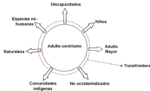
Figura 1. Adulto-centrismo y sus fronteras.

La figura 1, representa en esta búsqueda documental, las diversas formas en las que podemos insertar la temporalidad de nuestras existencias, así como la necesidad humana de dotar de sentido a lo que nos rodea, no debe estar completamente gobernada por la lógica del adulto-centrismo que nos hace pensar que el acmé de una vida surge en la aparente individualidad autónoma de la modernidad, supuestamente cuando se es un adulto, es decir cuando se logra ser independiente material y moralmente.