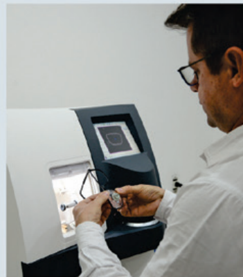
Laboratório com processo digital