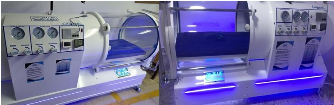
Figura 1. Cámara hiperbárica monoplaza Modelo: Calypso. Referencia:2021.