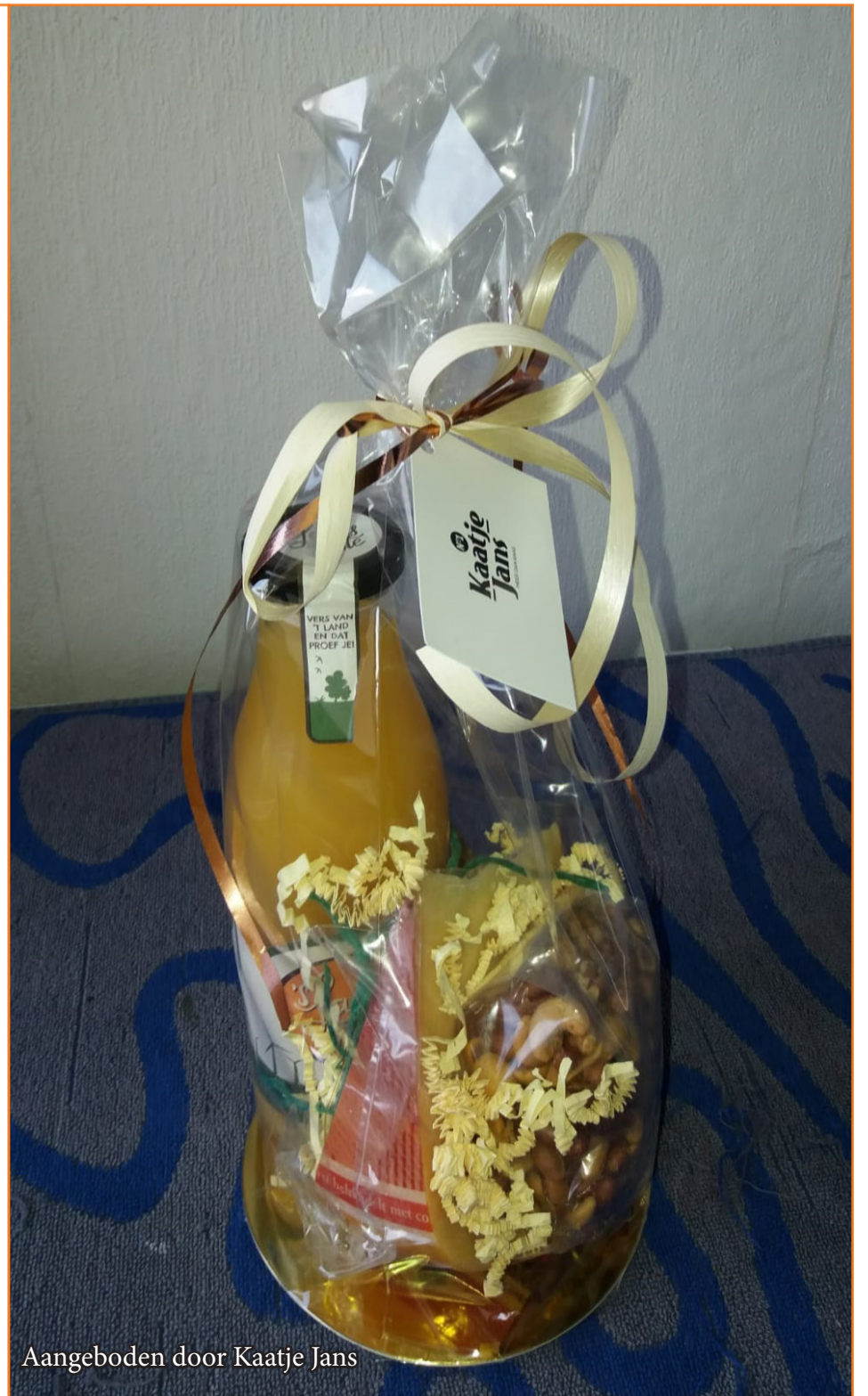
Aangeboden door Kaatje Jans