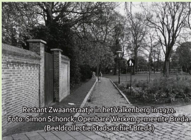
Restant Zwaanstraatje in het Valkenberg in 1979.

In 1592 kreeg de Doelstraat de naam Zwaanstraat. In 1812 werd de Zwaanstraat definitief zo genoemd en in het kadaster opgenomen. In 1963 werd de Kennedylaan aangelegd en wat toen nog over was van de Zwaanstraat verdween van de kaart. De restanten die overbleven was een kasseiweggetje dat het Valkenberg in liep. In dat straatje was ook het Katholiek Militair Tehuis (KMT) ondergebracht die in 1963 werd gesloopt. In 1987 werd het Luxor theater gesloopt. Zo was de Zwaanstraat van de aardbodem verdwenen.