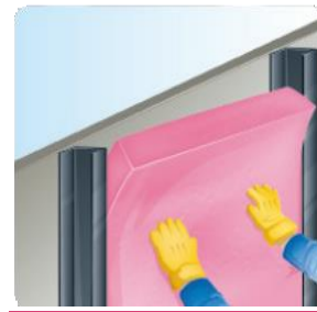
Presione hacia la cavidad.

Una vez que se fijan al muro o al techo las tiras de madera, el Aishhogar se coloca en los espacios libres entre bastidores. Tenga el cuidado de verificar que terminado de instalar el Aishhogar quede bien en contacto con el techo, el piso y los postes laterales. Encima de todo el conjunto y si la diferencia entre la temperatura exterior a interior llegara a ser muy alta (como en zonas de climas extremos), convendrá colocar una barrera de vapor (si el producto no cuenta con una). Esta barrera puede ser de Kraft Asfaltado. Posteriormente, y sobre la barrera de vapor, se procederá a colocar el tipo de acabado que se desee, pudiendo ser un lambrin de madera o un panel de yeso. En el caso del panel de yeso podrá adquirir papel tapiz o el acabado de su preferencia.