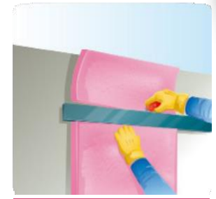
Corte el material excedente con una navaja o cuchillo con filo.