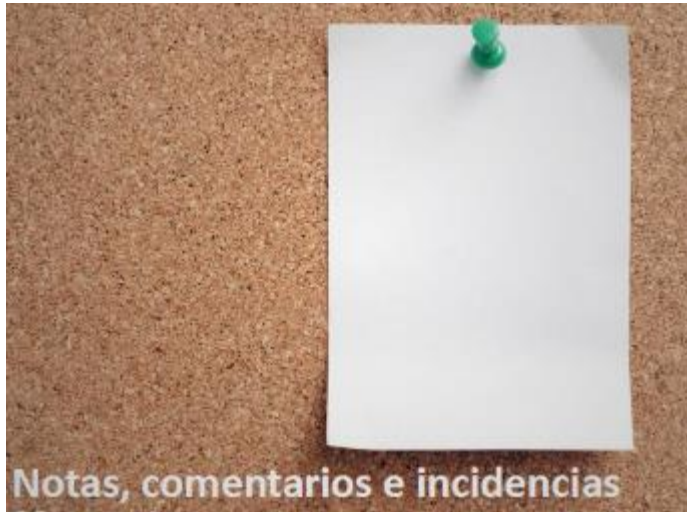
Notas, comentarios e incidencias