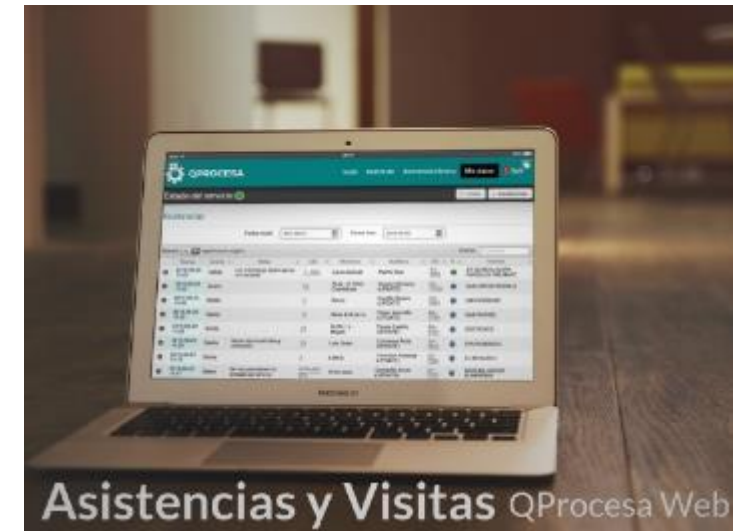
Asistencias y Visitas QProcesa Web