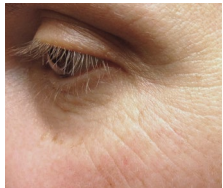
使用前和使用後的強烈對比

無論您想改善哪種肌膚問題，例如膚質不均勻、乾燥或細紋，或是哪個身體部位，RENU 28 都能協助改善。