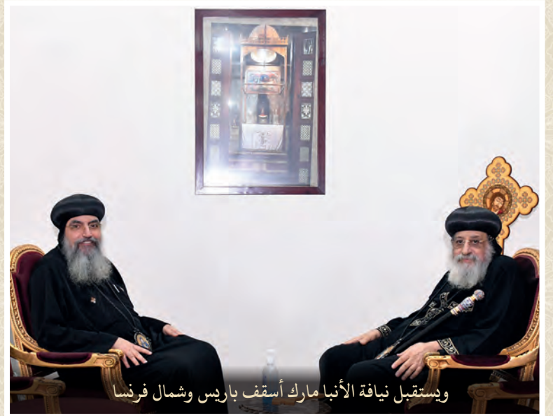
ويستقبل نيافة الأنبا مارك أسقف باريس وشمال فرنسا