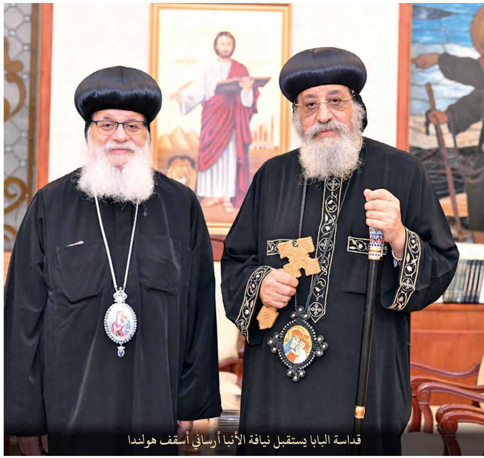
قداسة البابا يستقبل نيافة الأنبا أرساني أسقف هولندا