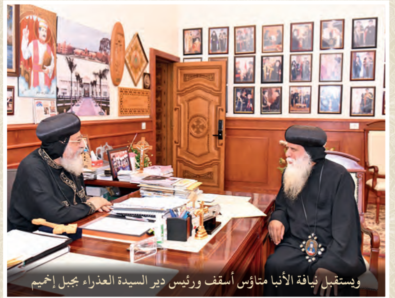
ويستقبل نيافة الأنبا متاؤس أسقف ورئيس دير السيدة العذراء بجبل إخميم