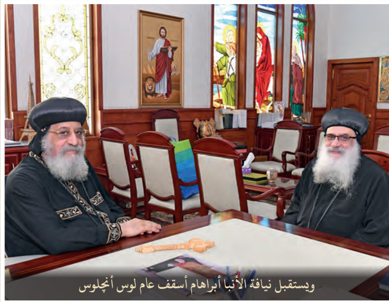
ويستقبل نيافة الأنبا أبراهام أسقف عام لوس أنجلوس