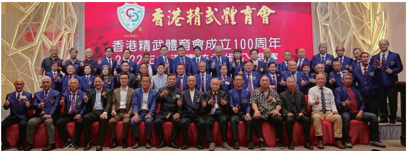
100 周年精武體育會全體 董事局與四位嘉賓

執行委員會 38 人，常務董事 27 人，董事 42 人， 競賽監督委員會 18 人，段位制決策委員會 13 人。