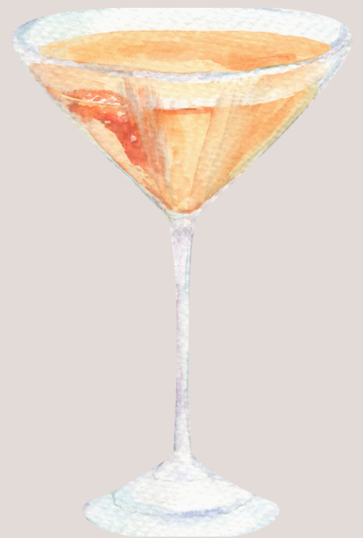
Pink Lychee Martini