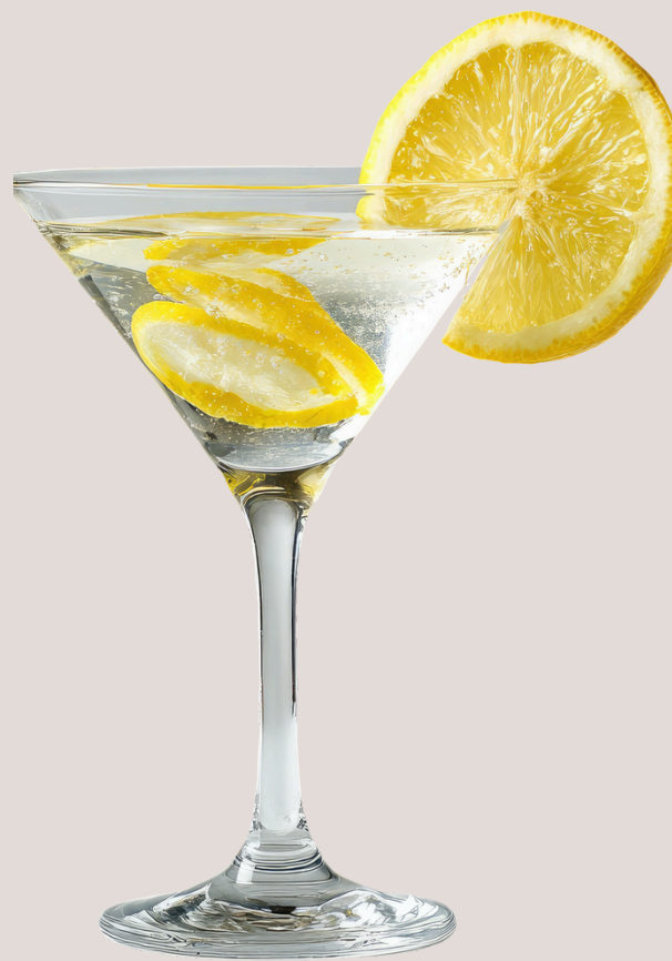
Limoncello de verano

Vodka, Tequila, Limon, coctel de frutas.